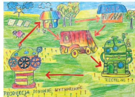
Nagrodzona praca - III miejsce Emilia Sieradzon klasa 2a