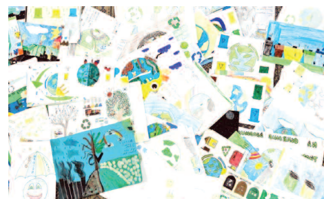
Przykładowe prace konkursowe

Warto dodać, że organizator otrzymał łącznie 4905 prac konkursowych uczniów ze 101 szkół z terenu województwa wielkopolskiego. Projekt „Zielone Wielkopolskie” był dofinansowany ze środków Wojewódzkiego Funduszu Ochrony Środowiska i Gospodarki Wodnej w Poznaniu.