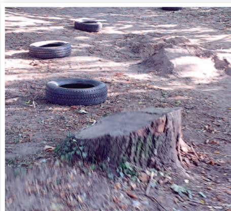
Park w Dusznikach