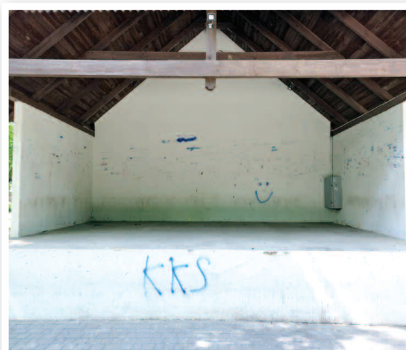
Muszla koncertowa w parku w Dusznikach