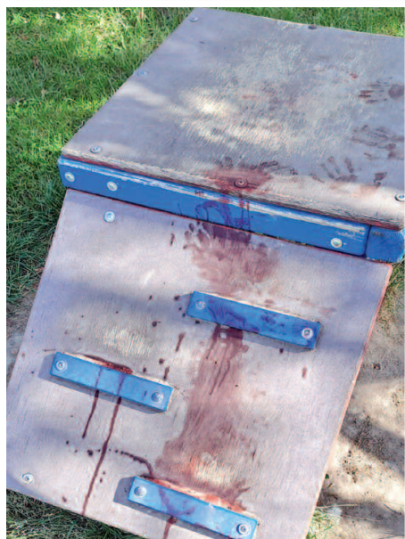
Plac zabaw w Podrzewiu