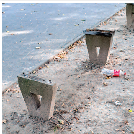
Uszkodzone ławki w parku w Dusznikach