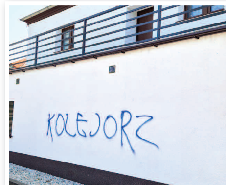
Zachodnio-północna ściana budynku CAK w Dusznikach

Tylko w tym roku Gmina Duszniki wyda kilkadziesiąt tysięcy złotych na naprawę skutków zniszczeń i wandalizmu na obiektach gminnych.