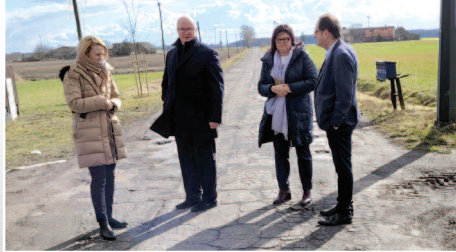
Rozmowy o potrzebach i planach inwestycyjnych >>> str. 4