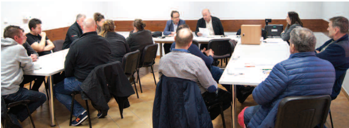
Zebranie wiejskie w Brzozie

W piątek 24 marca br. w dwóch nowych sołectwach – Brzozie i Grodziszczku – odbyły się zebrania wiejskie, na których zostali wybrani nowi sołtysi i rady sołectkie.