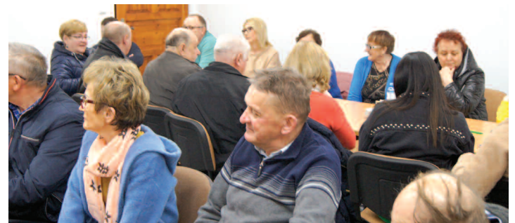
Zebranie wiejskie w Grodziszczku

Grodziszczka. 16 września ubiegłego roku złożyli oni wniosek do Wójta Gminy Duszniki o podział sołectwa na dwa odrębne. Grodziszczko zamieszkiwało wówczas 81 osób, a Brzozę 203 osoby. W listopadzie wójt zarządził przeprowadzenie konsultacji społecznych w sprawie podziału sołectwa. Odbyły się one 3 grudnia ubiegłego roku w sali wiejskiej w Grodziszczku. Konsultacje polegały na wyrażeniu opinii przez mieszkańców sołectwa o jego podziale. Na ogólną liczbę 288 uprawnionych wówczas mieszkańców, w konsultacjach wzięły udział 63 osoby, co stanowiło niemal 22 % uprawnionych. Za podziałem oddano 56 głosów, a przeciw podziałowi było 7 osób. Zgodnie z wolą mieszkańców, 28 grudnia ubiegłego roku Rada Gminy podjęła uchwałę o podziale sołectwa Brzoza – Grodziszczko na dwa odrębne, natomiast 27 lutego tego roku Rada uchwaliła nowe statuty odrębnych sołectw Brzoza i Grodziszczko.