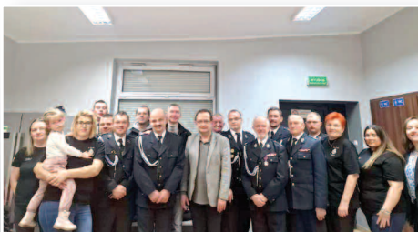
OSP Sędziny z nowym sprzętem >>> str. 6