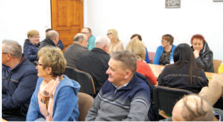
Brzoza i Grodziszczko - nowe sołectwa z nowymi sołtysami >>> str. 3