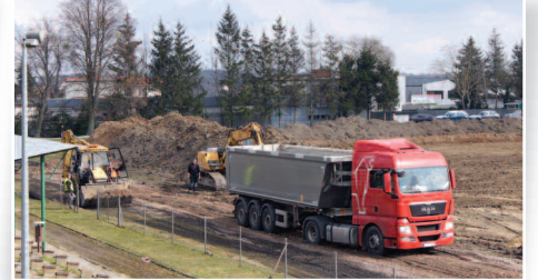
Przebudowa kompleksu sportowego przy ul. Sportowej >>> str. 5