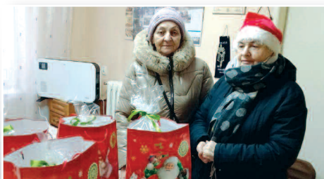
Podrzewianka świątecznie dla mieszkańców >>> str. 8