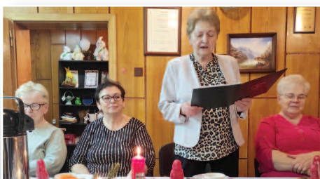
Świąteczne spotkanie Duszniczanki >>> str. 9