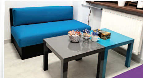
Dofinansowanie z programu "Kulisy Kultury" >>> str. 5