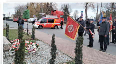
104. rocznica wybuchu Powstania Wielkopolskiego >>> str. 10