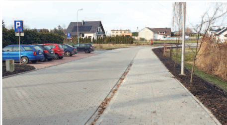
Nowa inwestycja w Dusznikach - ulica Stawna >>> str. 4