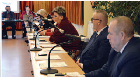
Budżet na 2023 r. i prace Rady Gminy Duszniki w 2022 r. >>> str. 3