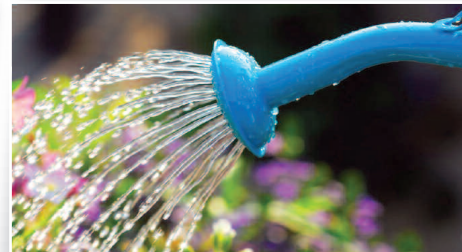
Apel o oszczędzanie wody w okresie upałów >>> str. 5