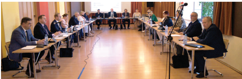
Sesja absolutoryjna 21 czerwca 2022 r.

W pierwszym półroczu 2022 r. Rada Gminy Duszniki obradowała na 9 sesjach, w tym 3 zwołanych w trybie nadzwyczajnym. Radni podjęli na nich w sumie 39 uchwał. Część z nich dotyczyła bieżących zmian wprowadzanych w trakcie roku w tegorocznym budżecie gminy. Pozostałe uchwały dotyczyły różnego rodzaju spraw