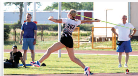
Sukcesy lekkoatletów z Dusznik >>> str. 12