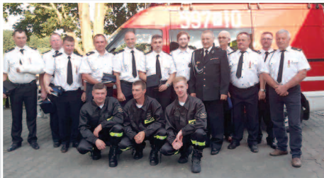
OSP Młynkowo z nowym wozem strażackim >>> str. 4