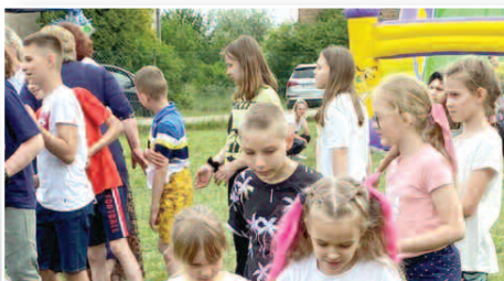
Piknik rodzinny w Wilkowie >>> str. 11