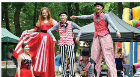
Piknik dla dzieci >>> str. 9