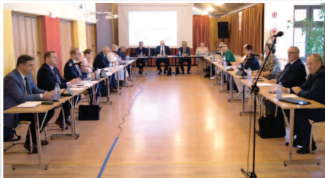
Absolutorium dla Wójta i prace Rady Gminy Duszniki >>> str. 3