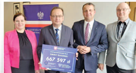
Wójt podpisał umowę na przebudowę ulicy Stawnej - str. 3