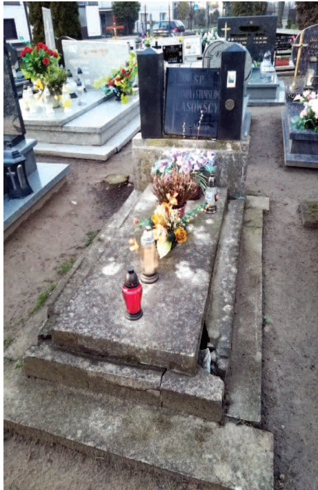
Pomnik przed remontem