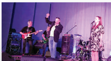
Blue Wave Band na scenie w Dusznikach - str. 11