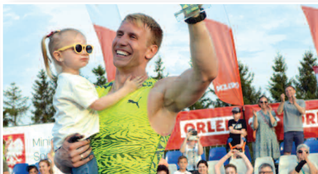
Międzynarodowy mityng skoku o tyczce w Dusznikach - str. 12-13