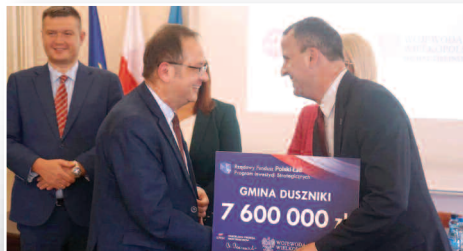
7 mln 600 tys. zł dla Gminy Duszniki - str. 3