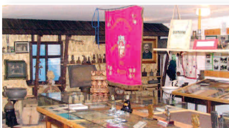
15 lat Izby Regionalnej w Dusznikach - str. 16