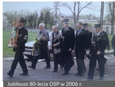
Jubileusz 80-lecia OSP w 2006 r.