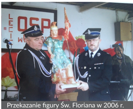
Przekazanie figury Św. Floriana w 2006 r.