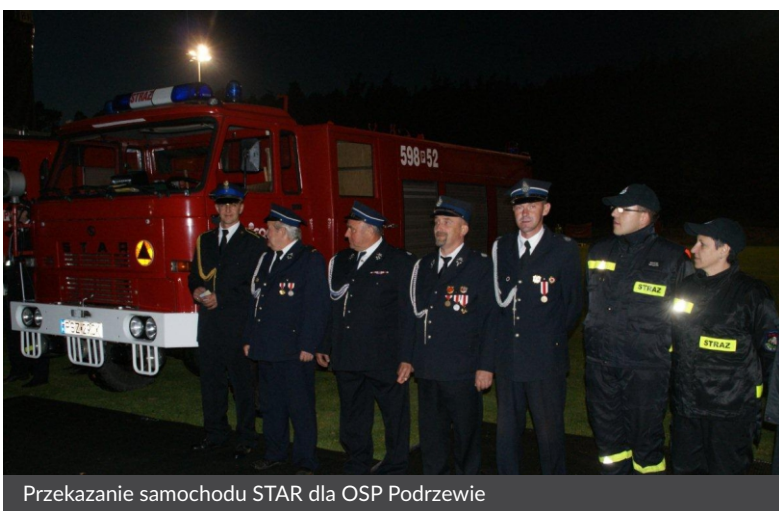
Przekazanie samochodu STAR dla OSP Podrzewie

7 maja 2016 r. Jednostka Ochotniczej Straży Pożarnej w Podrzewiu będzie obchodzić 90-lecie istnienia. Z tej okazji planowane są w Podrzewiu uroczystości połączone z zabawą taneczną.