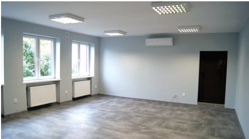
Pomieszczenie biurowe GZO