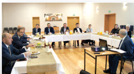
Spotkanie samorządowców KOLD w sali wiejskiej w Grzbieńsku - str. 8