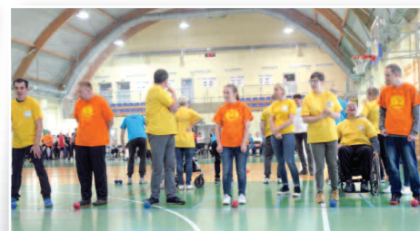
Turniej Boccia w Dusznikach - str. 15