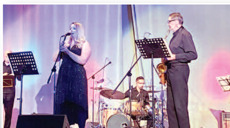
Czarowali jazzem - str. 12