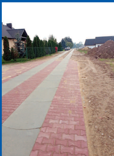
ul. Miodowa w Grzebienisku

W Grzebienisku na ulicy Miodowej wykonany został odcinek około 470 metrów bieżących.