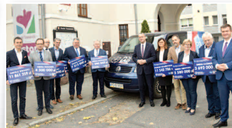
Projekt Gminy Duszniki wybrany do dofinansowania - str. 7