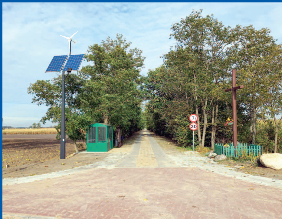
Droga w Sarbii

Koszt wykonania robót wyniósł 191.535 zł. W Sarbii przebudowano odcinek około 657 metrów bieżących za kwotę 270.627 zł. Wolną przestrzeń pomiędzy płytami o szerokości 1 metra utwardzono płytami typu JOMB.