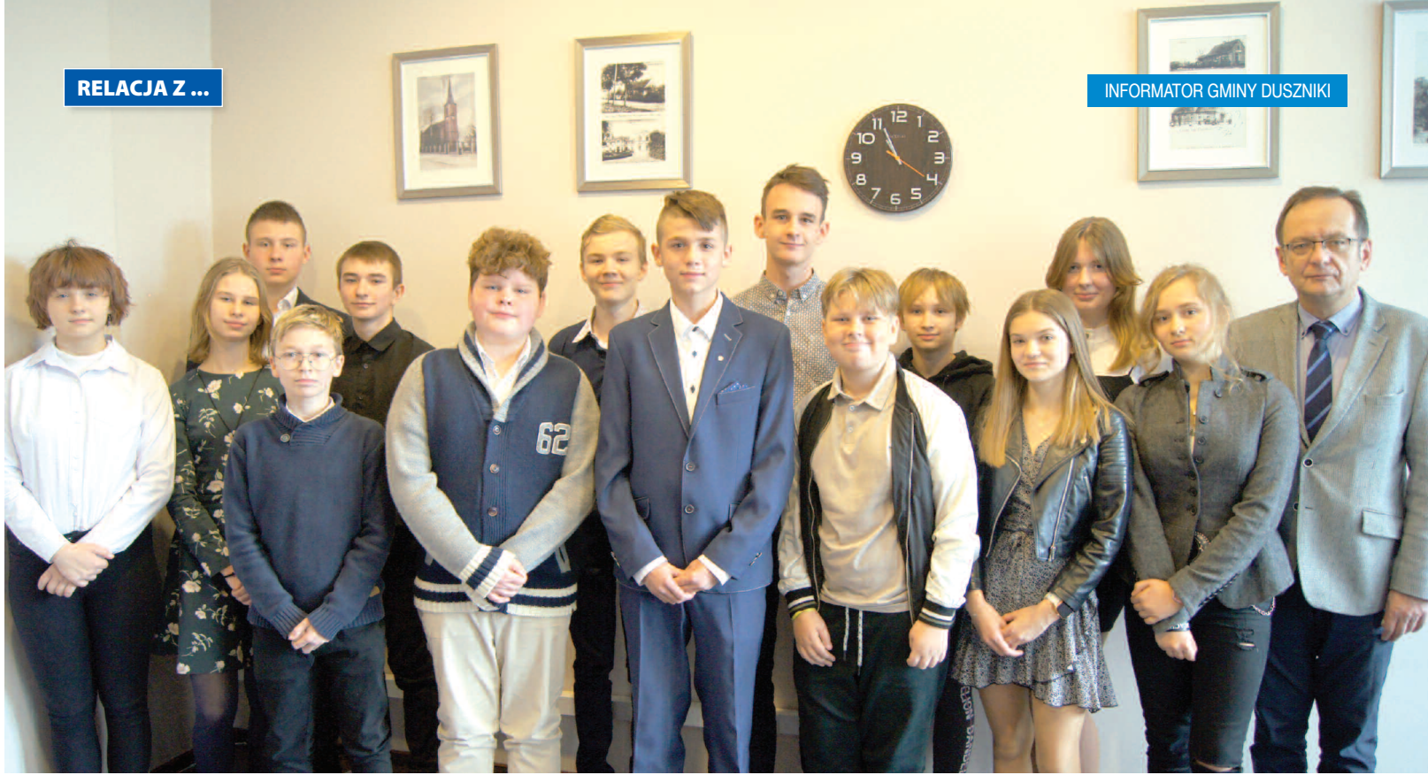
Młodzieżowa Rada Gminy Duszniki V kadencji z Wójtem