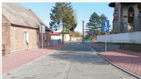
Nowe oblicze ulicy Kościelnej w Dusznikach - str. 5