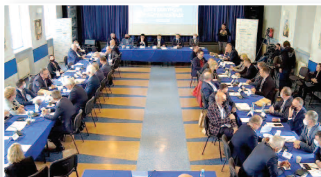
Gmina przeciw drastycznej podwyżce cen gazu - str. 3