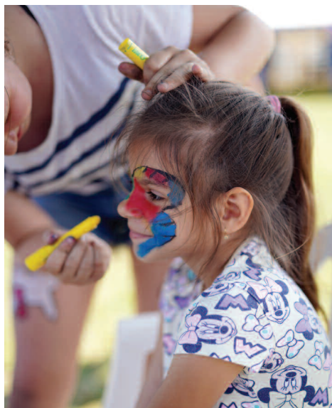
Festyn w Sarbii

Latem w większości sołectw zorganizowano festyny rodzinne dla mieszkańców. Imprezom towarzyszyły liczne atrakcje dla dzieci: dmuchańce, wata cukrowa, malowanie twarzy, ścianki wspinaczkowe, animacje sportowe i pokazy miejscowych jednostek OSP.