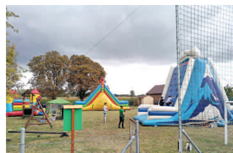
Festyn w Kunowie