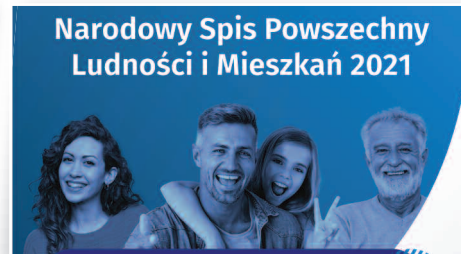
Narodowy Spis Powszechny Ludności i Mieszkań 2021