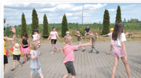
Piknik rodzinny w Chełminku - str. 19