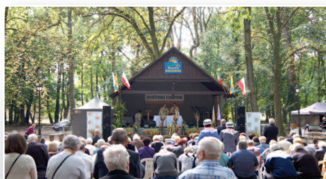
Święto Plonów w Dusznikach - str. 12-13