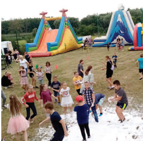
Festyn w Wilczynie