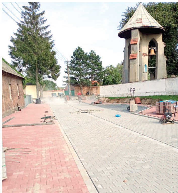
ul. Kościelna w Dusznikach