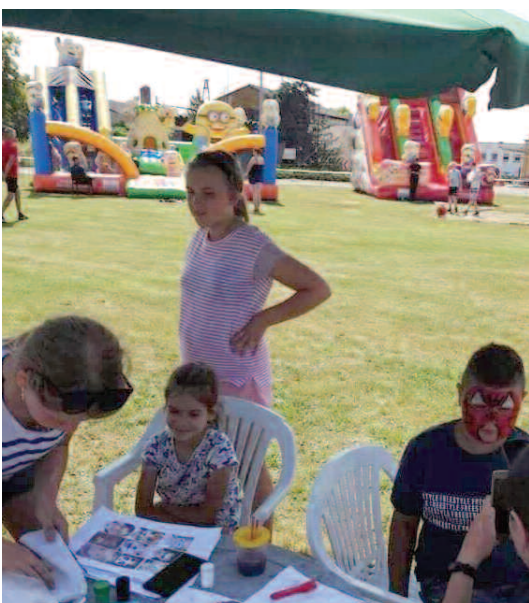
Festyn w Sarbii

Festyny zorganizowano w Wilczynie, Kunowie, Mieściskach, Sarbii, Niewierzu i Sękowej. Dla mieszkańców Grzebieniska sołectwo zorganizowało zabawę taneczną, a mieszkańcy Sędzinka i Zalesia mieli możliwość wzięcia udziału w rajdzie rowerowym.