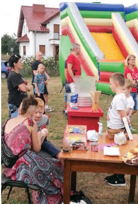
Festyn w Mieściskach

Latem w większości sołectw zorganizowano festyny rodzinne dla mieszkańców. Imprezom towarzyszyły liczne atrakcje dla dzieci: dmuchańce, wata cukrowa, malowanie twarzy, ścianki wspinaczkowe, animacje sportowe i pokazy miejscowych jednostek OSP.