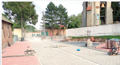
Gmina realizuje kolejne inwestycje - str. 5