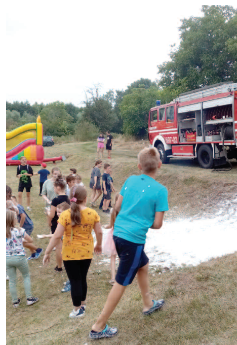
Festyn w Wilczynie