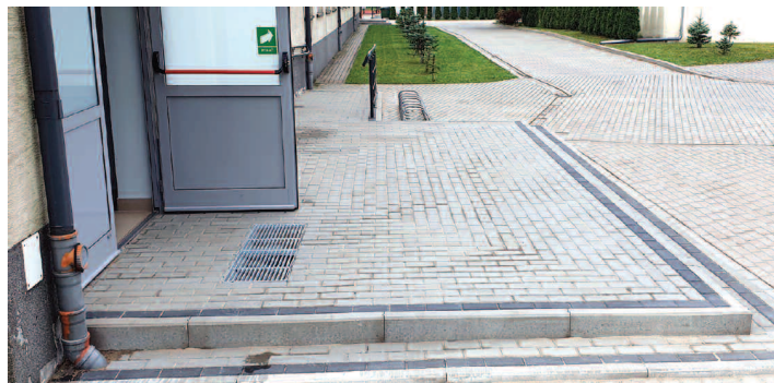
Schody przy sali sportowej w Dusznikach

W sierpniu br. trwały prace remontowe schodów zewnętrznych do sali sportowej przy ul. Broniewskiego w Dusznikach. Remontowano schody przy wejściu głównym do sali sportowej, bocznym oraz tylnym. W zakres robót wchodziła rozbiórka istniejących schodów, wykonanie odpowiedniej podbudowy, a następnie schodów z kostki brukowej wraz z podjazdem dla inwalidów oraz w przypadku stopni przy wejściu głównym poprawa nawierzchni wokół schodów w celu lepszego odprowadzenia wody deszczowej. Wykonawcą inwestycji była firma E-RENT Mariusz Drasik, a koszt remontu wyniósł 47.600 zł. Wkrótce zostanie również uzupełniona opaska tynkowa, co poprawi estetykę budynku.