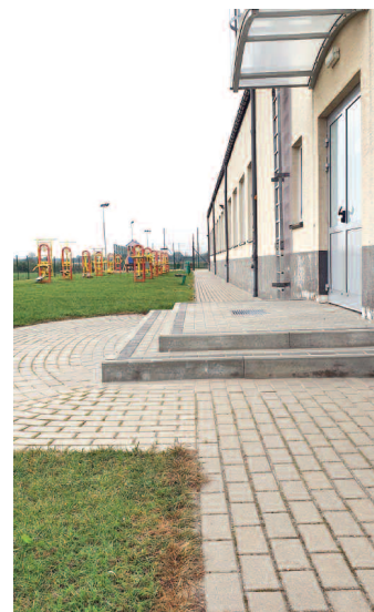
Schody przy sali sportowej w Dusznikach

W sierpniu br. trwały prace remontowe schodów zewnętrznych do sali sportowej przy ul. Broniewskiego w Dusznikach. Remontowano schody przy wejściu głównym do sali sportowej, bocznym oraz tylnym. W zakres robót wchodziła rozbiórka istniejących schodów, wykonanie odpowiedniej podbudowy, a następnie schodów z kostki brukowej wraz z podjazdem dla inwalidów oraz w przypadku stopni przy wejściu głównym poprawa nawierzchni wokół schodów w celu lepszego odprowadzenia wody deszczowej. Wykonawcą inwestycji była firma E-RENT Mariusz Drasik, a koszt remontu wyniósł 47.600 zł. Wkrótce zostanie również uzupełniona opaska tynkowa, co poprawi estetykę budynku.