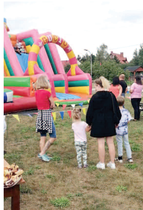
Festyn w Mieściskach

Festyny zorganizowano w Wilczynie, Kunowie, Mieściskach, Sarbii, Niewierzu i Sękowej. Dla mieszkańców Grzebieniska sołectwo zorganizowało zabawę taneczną, a mieszkańcy Sędzinka i Zalesia mieli możliwość wzięcia udziału w rajdzie rowerowym.