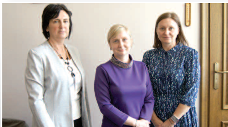
Awanse zawodowe w oświacie - str. 6