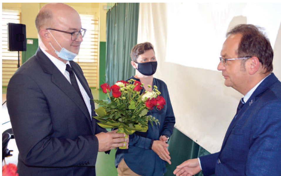
Gratulacje dla Wójta Gminy Duszniki po uchwaleniu absolutorium

W okresie wakacyjnym Rada Gminy Duszniki obradowała na czterech sesjach. Dwie z nich odbyły się 30 czerwca, następane 27 lipca i 19 sierpnia.