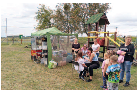
Festyn w Kunowie