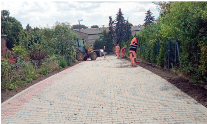
ul. Na Wzgórzu w Wilczynie

Przebudowa ulicy Na Wzgórzu w Wilczynie to jedna z wielu inwestycji drogowych, które są realizowane na terenie Gminy Duszniki w tym roku. Inwestycja ta została już ostatecznie odebrana 26 sierpnia. Łączna kwota robót wyniosła 107.145 zł. Prace polegały na przebudowie pasa drogowego na długości 97 mb poprzez wykonanie nawierzchni jezdni, opaski i zjazdów z kostki brukowej betonowej. Wykonawcą tej inwestycji była firma Renomex z Dusznik.