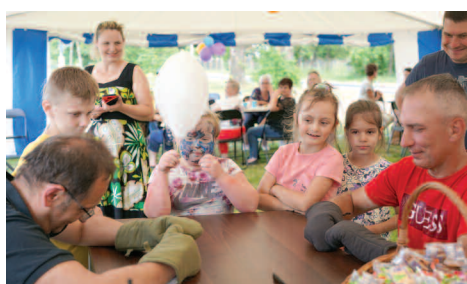
Festyn w Sarbii