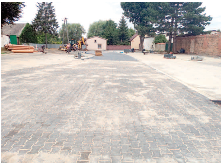
ul. Kościelna w Dusznikach