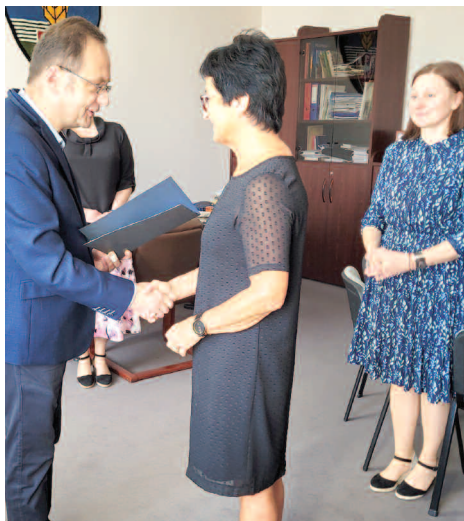
Powierzenie satnowiska dyrektora szkoły