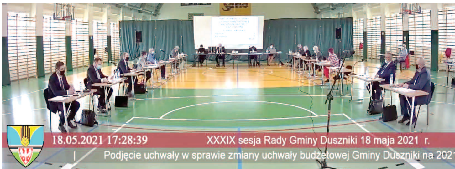
38. sesja Rady Gminy Duszniki