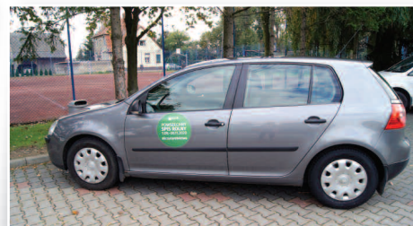
„Złap spis w gminie” - konkurs dla mieszkańców - str. 7