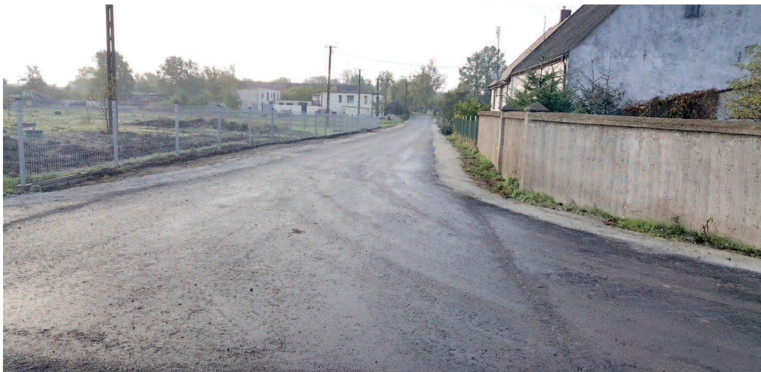
Droga w Wilkowie