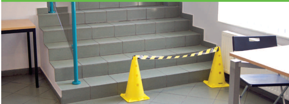
Znak ograniczenia przejścia do biur