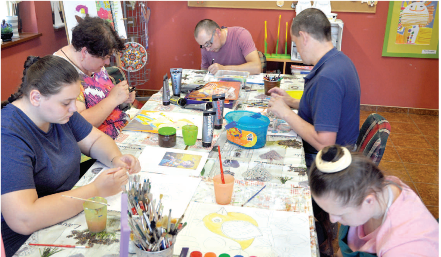
Warsztat Terapii Zajęciowej w Dusznikach podczas pracy