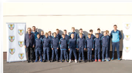
Sokół Duszniki na BAŁTYK CUP 2020 w Niechorzu - str. 14