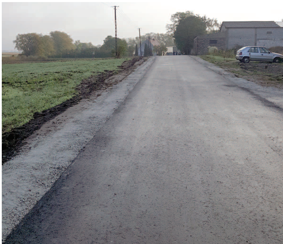
Droga w Wilkowie

i Okrężnej, Zakrzewko, Niewierz ul. Kasztanowa – etap II oraz w Sędzinach ul. Niegołowska.