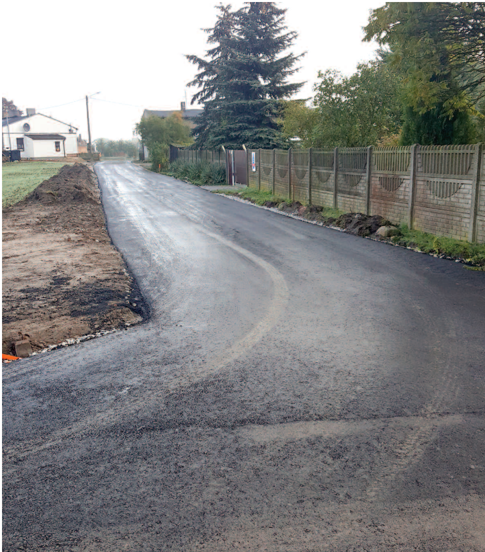
Droga w Zakrzewku