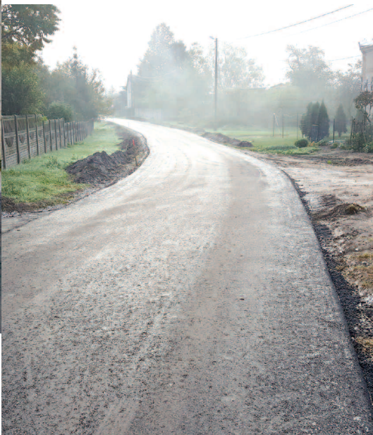
Droga w Zakrzewku