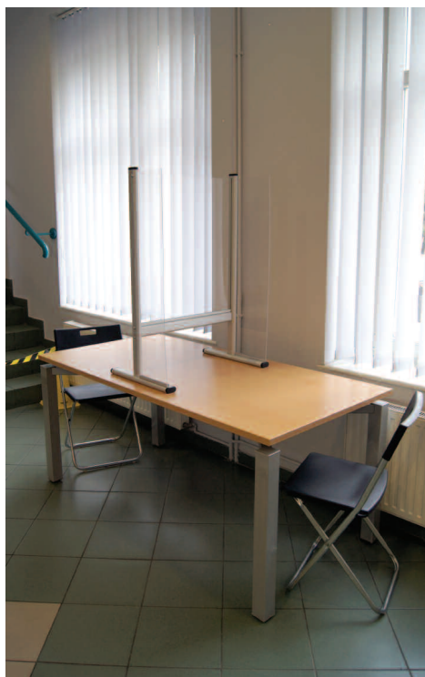
Stanowisko obsługi dla klientów urzędu

Wprowadzone w urzędzie rozwiązania okazały się skuteczne i wystarczające, a protokół z kontroli zawierał pozytywną ocenę ich stosowania.