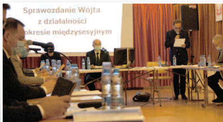
Z prac Rady Gminy - str. 3