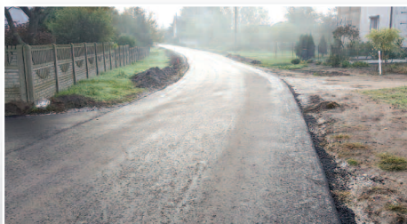
Kolejne inwestycje drogowe w gminie z dofinansowaniem - str. 4-5