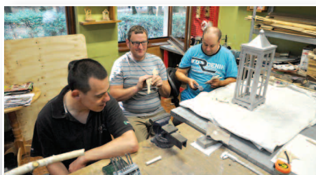
Ponad 80 tysięcy zł dla Gminy Duszniki - str. 8