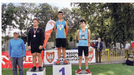
Udany sezon lekkoatletów UKS Olimp Duszniki - str. 12-13