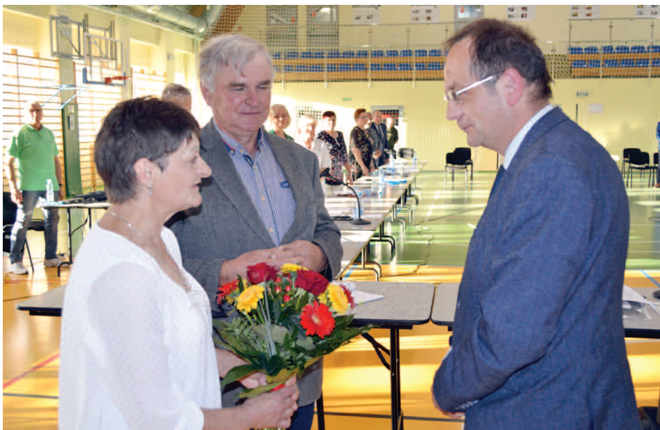
Sołtysi gratulują Wójtowi uzyskania absolutorium, 23 czerwca 2020 r.

zatwierdzeniem sprawozdania finansowego za 2019 r., które było wcześniej przedmiotem analizy przez Regionalną Izbę Obrachunkową w Poznaniu – organ nadzorujący gospodarkę finansową gminy. RIO pozytywnie oceniło wykonanie ubiegłorocznego budżetu, natomiast radni jednogłośnie zagłosowali za jego zatwierdzeniem. Ostatnim i najważniejszym punktem tej sesji było głosowanie nad udzieleniem absolutorium Wójtowi Gminy Duszniki. Tutaj również wszyscy radni byli jednomyślni i zagłosowali za przyjęciem uchwały.