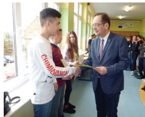
Stypendysta za wysokie wyniki w nauce z Wójtem (zdjęcie z lutego 2020 r.)

Program stypendialny dla najzdolniejszych uczniów w Gminie Duszniki funkcjonuje już od ponad 4 lat, tj. od stycznia 2016 roku. Przez ten czas wójt przyznał w sumie 424 stypendia i na-