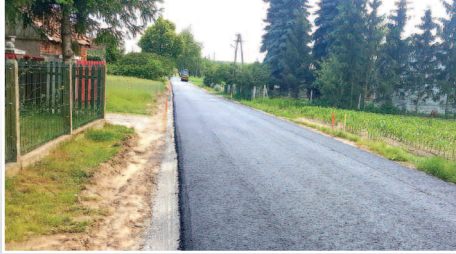
Przebudowa ul. Leśnej w Niewierzu – str. 6