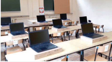
Szkoły podstawowe z nowymi laptopami – str. 5