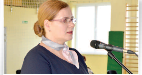
Absolutorium dla Wójta i nowa Skarbnik Gminy – str. 4-5