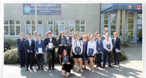
Wyjątkowe podziękowania – str. 8