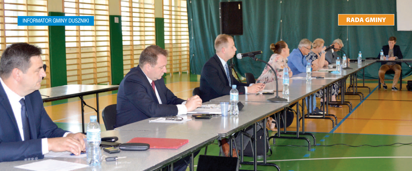
Sesja Rady Gminy Duszniki, 30 czerwca 2020 r.