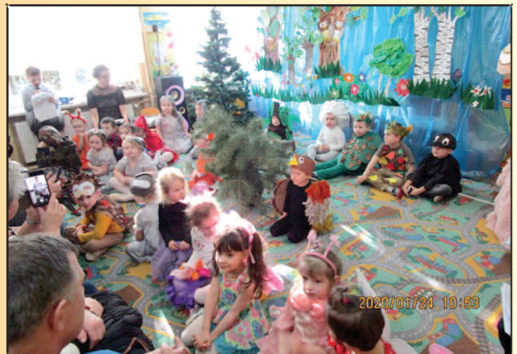
Dzień Babci i Dziadka w Sękowie