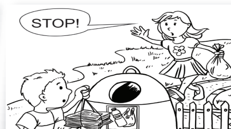
Kolorowanka ekologiczna EKodzieciaki – str. 19