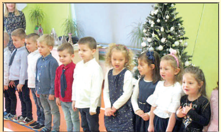
Dzień Babci i Dziadka w Dusznikach