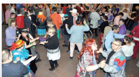
VII Bal Karnawałowy WTZ Duszniki – str. 12-13