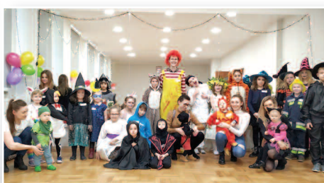
Ferie z Biblioteką – str. 14