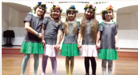
Złoto i srebro dla „Piątek” i „Sikorek” z Grzebieniska – str. 15