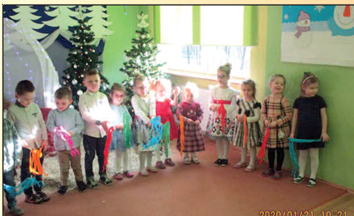
Dzień Babci i Dziadka w Podrzewiu