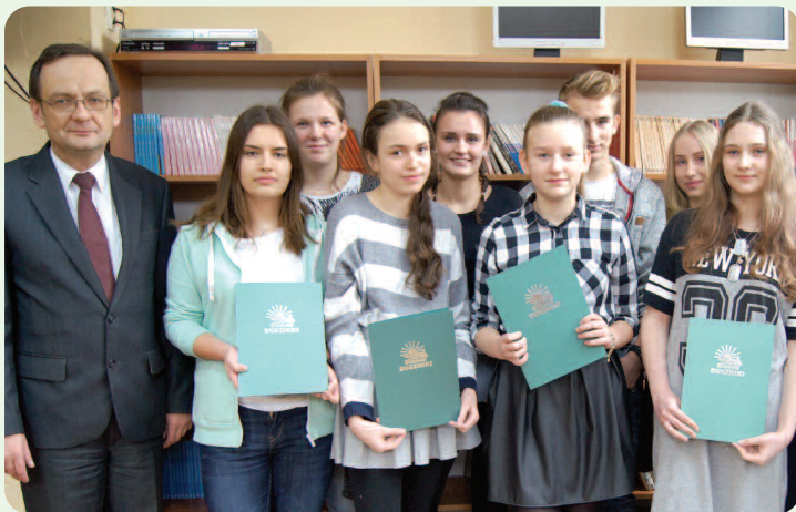
Pierwsi stypendyści w 2016 r. z Gimnazjum w Dusznikach

czas wójt przyznał w sumie 376 stypendiów. Kwota z budżetu, którą do tej pory zainwestowano w młodych i uzdolnionych mieszkańców naszej gminy wyniosła prawie 96 tysięcy zł.