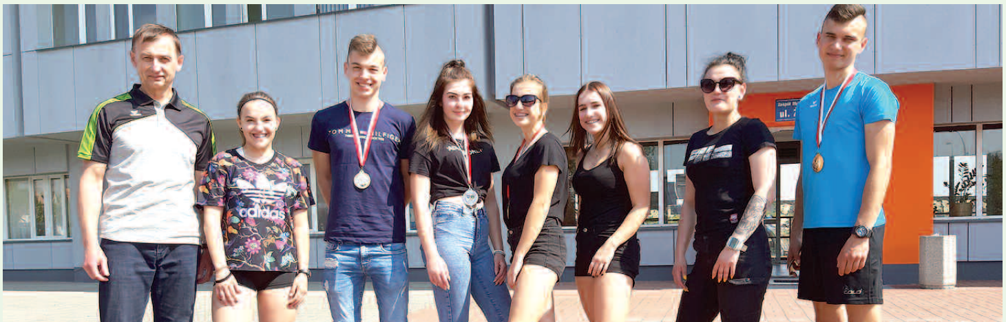
Zdobywcy stypendiów sportowych w 2019 r. z trenerem