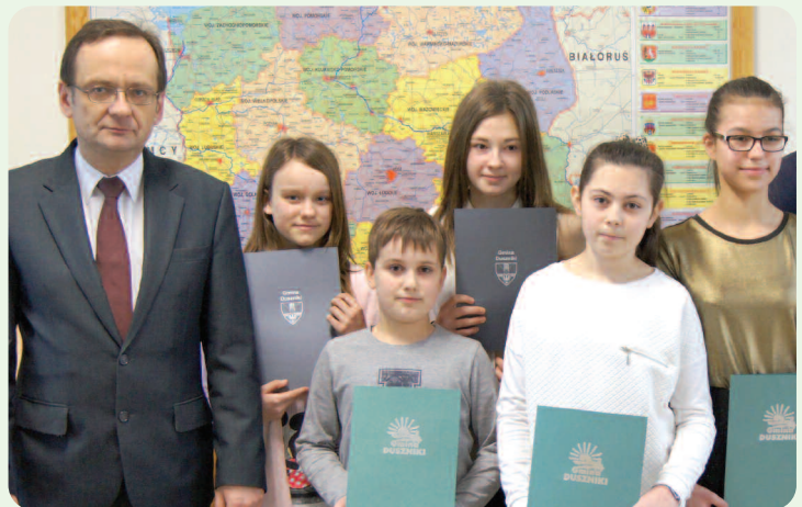
Pierwsi stypendyści w 2016 r. z SP Duszniki