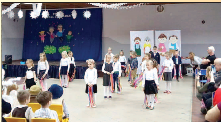
Dzień Babci i Dziadka w Sędzinku