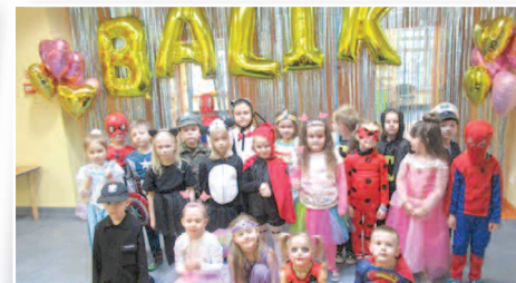
Dzieje się w przedszkolach – str. 10