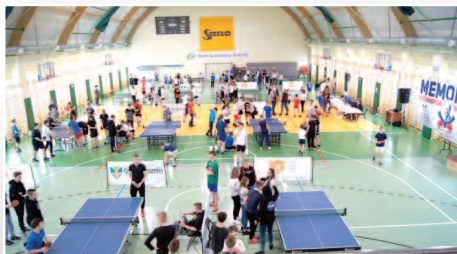
Święto tenisa stołowego w Dusznikach – str. 8-9