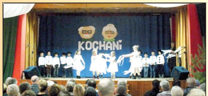
Dzień Babci i Dziadka w Grzbieńniku