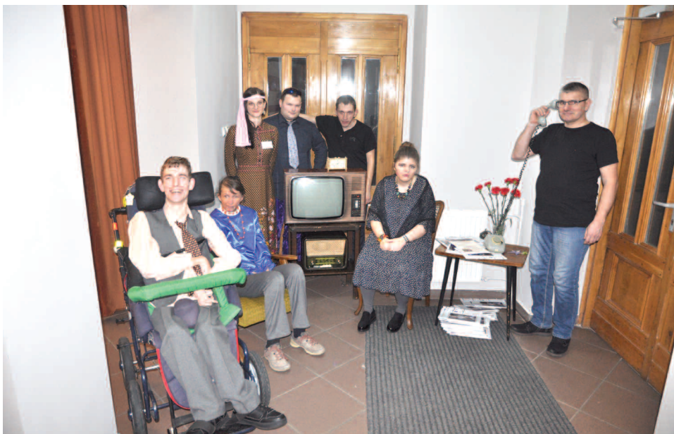
Pracownia gospodarstwa domowego