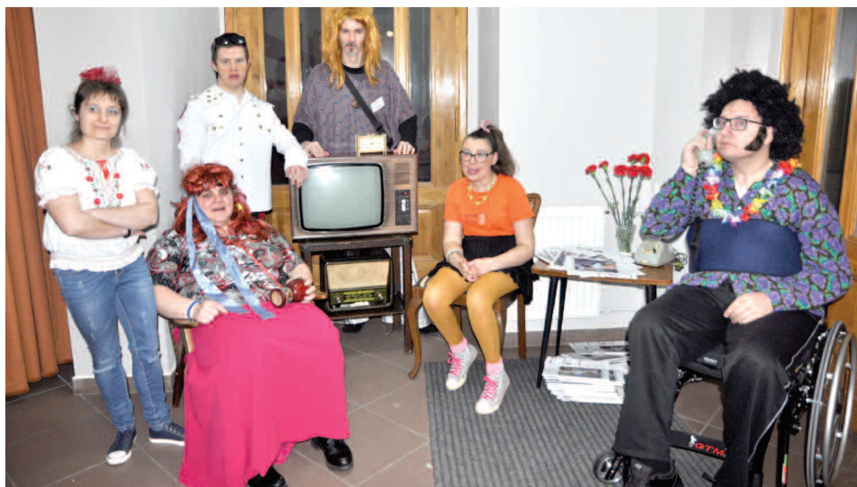
Pracownia zaradności osobistej i społecznej

Prawdziwy czar epoki PRL można było poczuć podczas VII Balu Karnawałowego zorganizowanego przez Warsztaty Zajęciowej w Dusznikach.