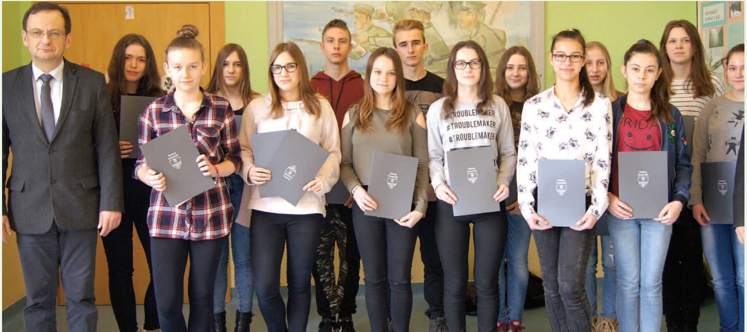
Laureaci stypendiów za wysokie wyniki w nauce i sporcie w 2017 r.