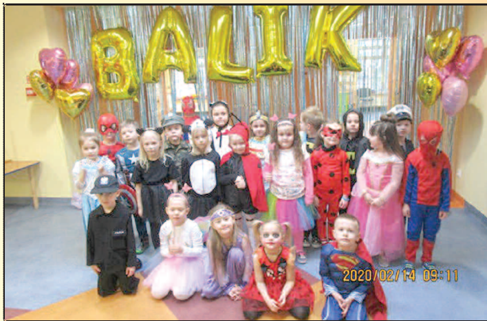
Balik karnawałowy w przedszkolu w Dusznikach