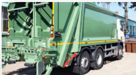
Odbiór odpadów – nowe stawki w 2020 r. – str. 4