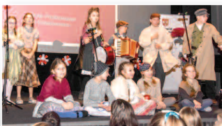
Patriotyczny i muzyczny listopad – str. 16