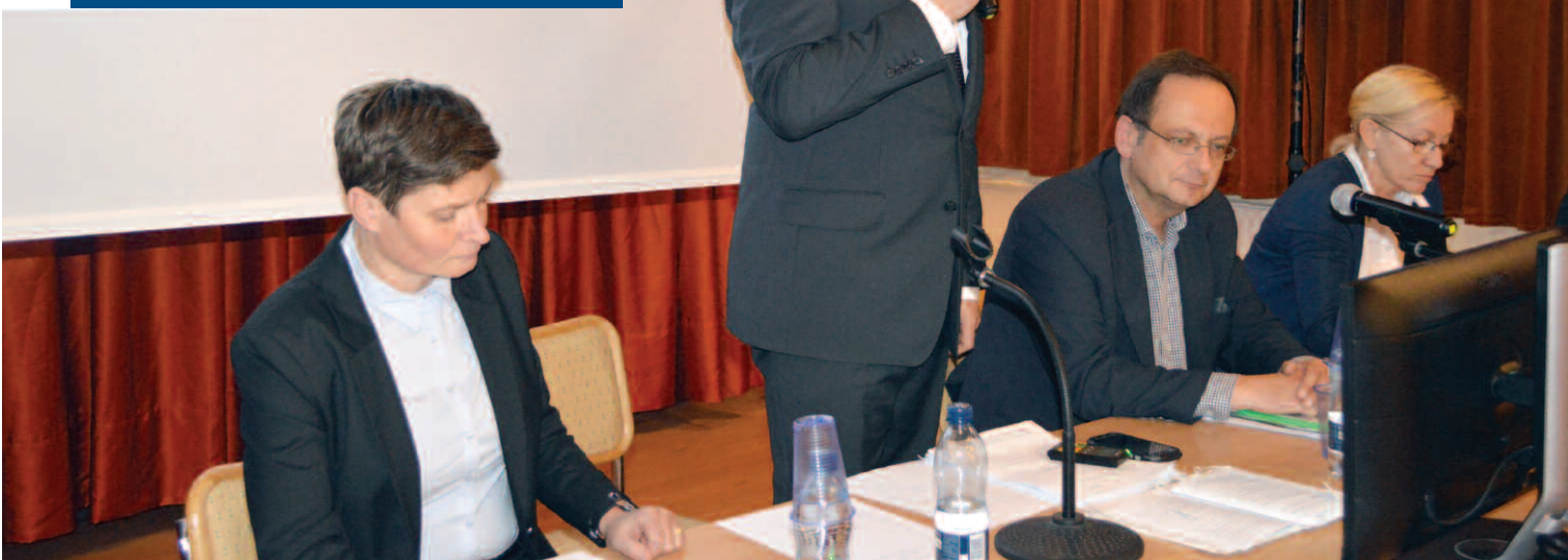
Sesja Rady Gminy Duszniki w listopadzie 2019 r.

25 listopada 2019 r. na 19. sesji radni podjęli jedenaście uchwał. Dwie z nich dotyczyły zmian w budżecie. Również dwie były poświęcone zmianom w zakresie opłat za odbiór odpadów od mieszkańców gminy. Więcej informacji o stawkach opłat w 2020 roku znajduje się w artykule „Odbiór odpadów – nowe stawki w 2020 r.”