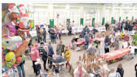
Dusznicki jarmark bożonarodzeniowy – str. 14