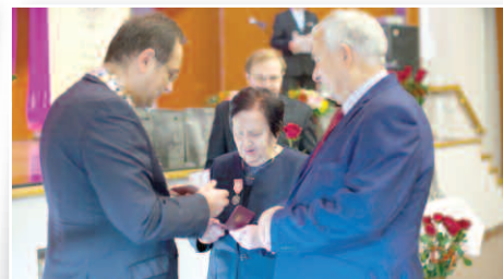
Jubileusz 50, 55, 60 i 70-lecia pożycia małżeńskiego – str. 10-11