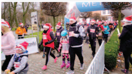
Charytatywny Bieg Mikołajkowy w Dusznikach – str. 8-9