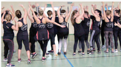
Aktywny piątkowy wieczór fitness – str. 10