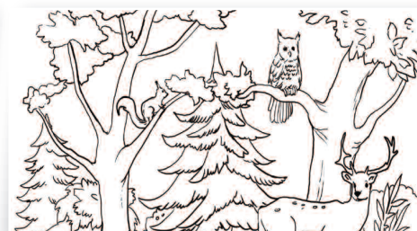
Kolorowanka ekologiczna dla najmłodszych – str. 19