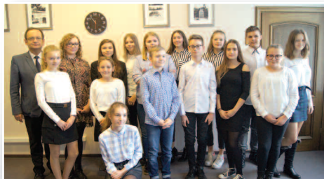
Kolejna kadencja Rady Młodzieży – str. 11