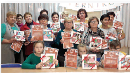
Warsztaty ozdabiania pierników w Wilkowie – str. 17