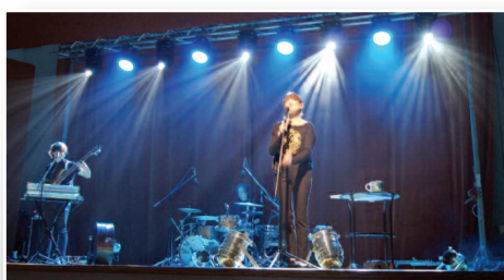
Ach, co to był za koncert... – str. 14