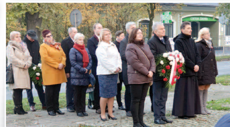
Obchody Narodowego Święta Niepodległości – str. 12