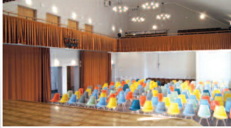
Nowe oblicze dusznickiego CAK'u – str. 5