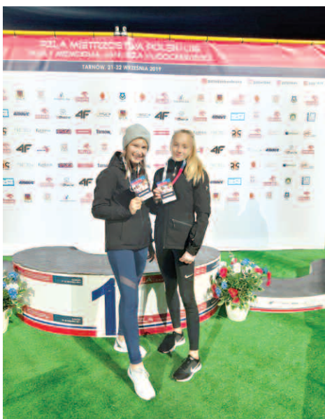
Reprezentantki UKS Olimp na Mistrzostwach Polski w Tarnowie