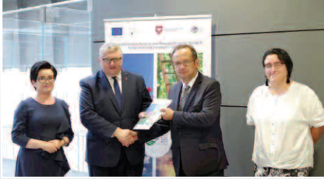
Gmina Duszniki otrzymała dofinansowanie na drogę w Niewierzu – str. 4