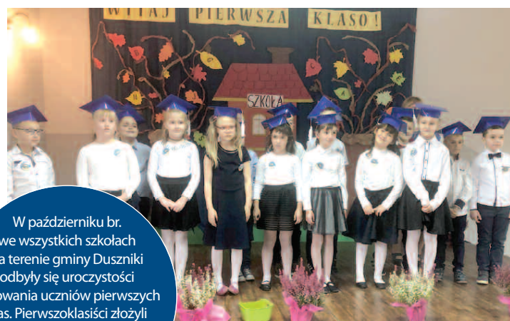
Pierwszoklasiści z Sędzinka

W październiku br. we wszystkich szkołach na terenie gminy Duszniki odbyły się uroczystości pasowania uczniów pierwszych klas. Pierwszoklasiści złożyli ślubowanie, stając się tym samym częścią szkolnej społeczności.