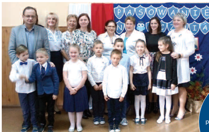
Pasowanie na ucznia pierwszoklasistów z Podrzewia