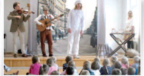
Październikowe spotkanie ze sztuką i kulturą – str. 14