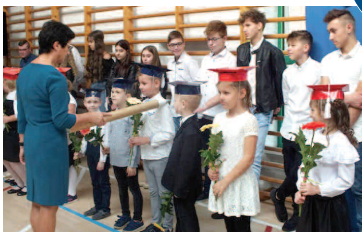
Ślubowanie pierwszoklasistów w Grzebienisku

W październiku br. we wszystkich szkołach na terenie gminy Duszniki odbyły się uroczystości pasowania uczniów pierwszych klas. Pierwszoklasiści złożyli ślubowanie, stając się tym samym częścią szkolnej społeczności.