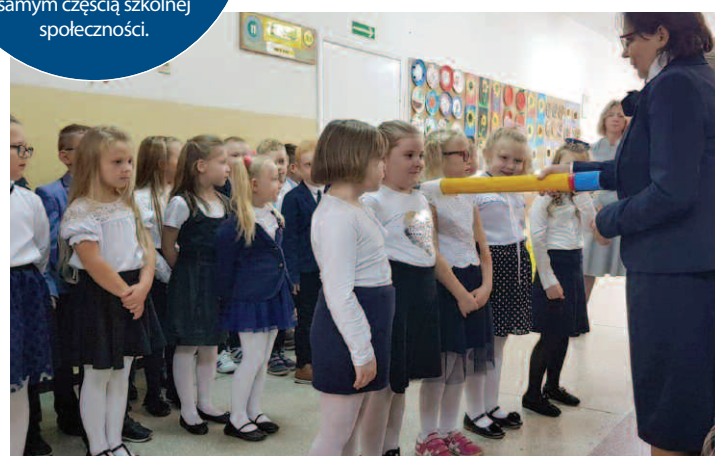
Pasowanie pierwszoklasistów w Dusznikach