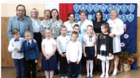
Pierwszoklasiści zostali pasowani uczniów – str. 13