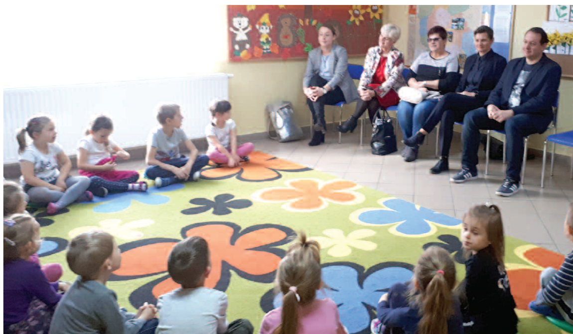
Radni z Komisji Oświaty na wyjazdowym posiedzeniu w przedszkolu w Sędzinku