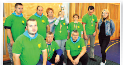
WTZ Duszniki z III miejscem w Turnieju Kręglarskim – str. 18