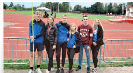
Wrześniowe sukcesy sportowców UKS Olimp – str. 14