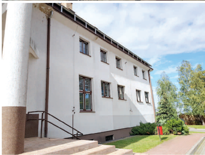
Remont budynku CAK w Dusznikach

W Centrum Animacji Kultury w Dusznikach trwają prace budowlane i remontowe. Inwestycja polega na wymianie okien, malowaniu sali widowiskowej i sceny, naprawie i cyklinowaniu podłogi sceny. Wykonawcą jest firma PHU „REMSTAL” z Dusznik, a koszt realizacji tej inwestycji wynosi prawie 195 tys. zł. Inwestycja jest dofinansowana ze środków Unii Europejskiej z Programu Rozwoju Obszarów Wiejskich w wysokości prawie 64% poniesionych kosztów.