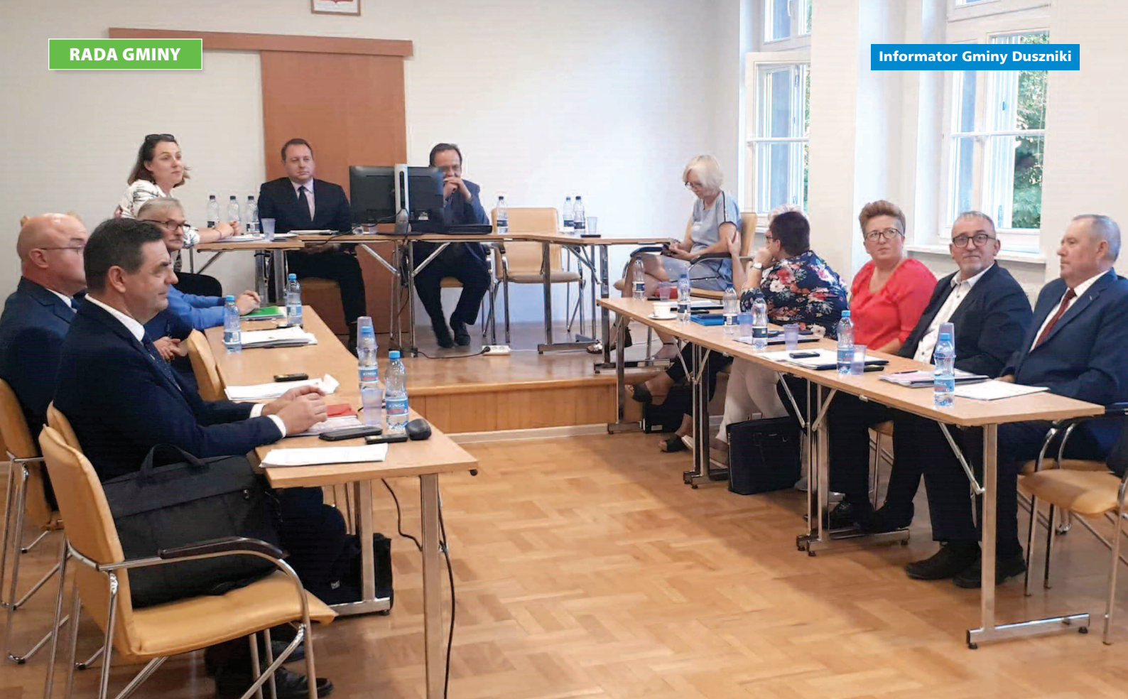
Sesja Rady Gminy Duszniki, 4 września 2019 r.