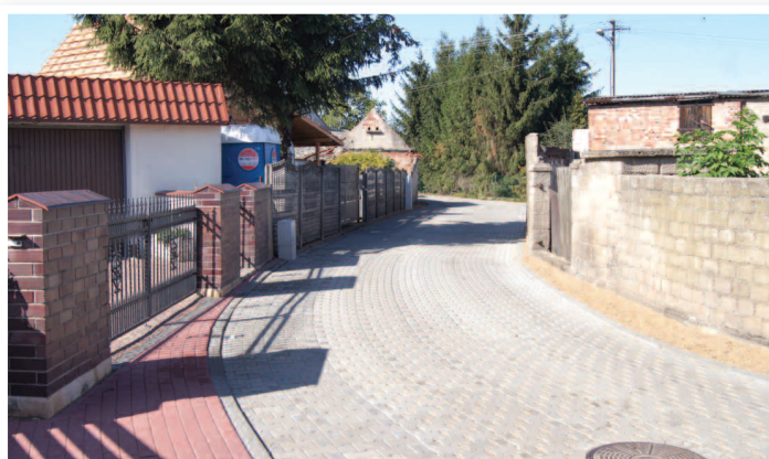
ul. Wąska w Podrzewiu

W Centrum Animacji Kultury w Dusznikach trwają prace budowlane i remontowe. Inwestycja polega na wymianie okien, malowaniu sali widowiskowej i sceny, naprawie i cyklinowaniu podłogi sceny. Wykonawcą jest firma PHU „REMSTAL” z Dusznik, a koszt realizacji tej inwestycji wynosi prawie 195 tys. zł. Inwestycja jest dofinansowana ze środków Unii Europejskiej z Programu Rozwoju Obszarów Wiejskich w wysokości prawie 64% poniesionych kosztów.