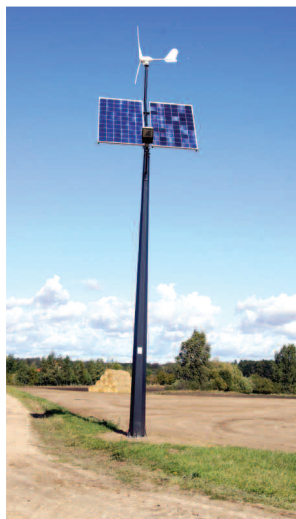
Lampa hybrydowa na ul. Miodowej w Grzebienisku

W ramach inwestycji w oświetlenie drogowo w kilku miejscowościach zostały zamontowane lampy solarne hybrydowe: w Grzebienisku na ul. Miodowej (3 lampy), w Ceradzu Dolnym, ul. Parkowa oraz przy drodze Brzoza-Ceradź Dolny (2 lampy), w Chełminku (1 lampa), w Dusznikach, ul. Bukowska i ul. Polna (2 lam-