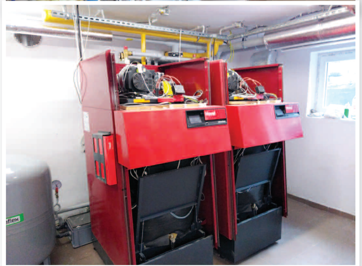
Kotłownia w szkole w Grzebienisku