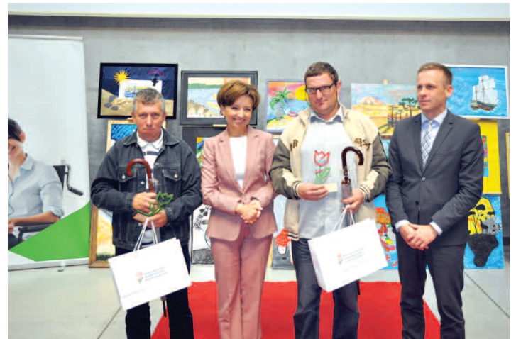
Zdobywcy I miejsca z organizatorami konkursu