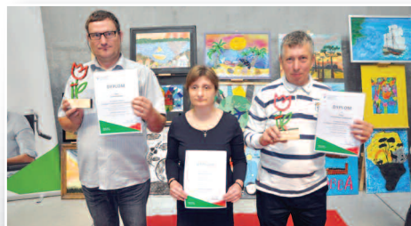
Podróże moich marzeń – str. 16