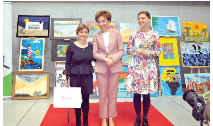
Zdobywczyńi III miejsca z organizatorami konkursu