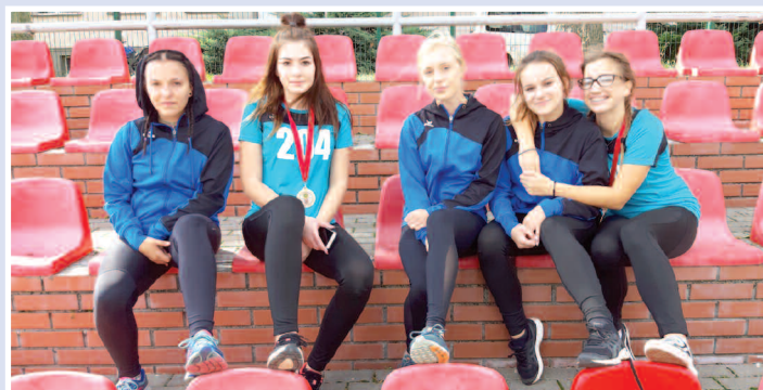
Zawodniczki UKS Olimp w Mistrzostwach Wielkopolski, 18 września 2019 r