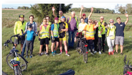
Hop na rower – str. 17