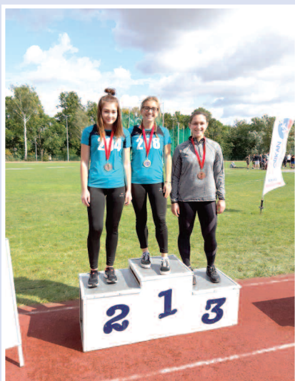
Złoty i srebrny medal dla oszczepniczek z UKS Olimp we Wrześni

7 września br. w Szczecinie odbyły się Międzywojewódzkie Mistrzostwa Młodzików w lekkiej atletyce. W zawodach rywalizowali najlepsi zawodnicy w wieku 14-15 lat, z województwa wielkopolskiego i zachodniopomorskiego. Zawody te są prestiżowo traktowane przez każdy klub sportowy. Jest to jedyna impreza w roku, w której młodzicy mogą zdobywać punkty do Ogólnopolskiego Współzawodnictwa Sportu Dzieci i Młodzieży wg zasady: 1 miejsce -3 pkt, 2 i 3 miejsce - 2 pkt., miejsca od 4 do 11 - 1 pkt.