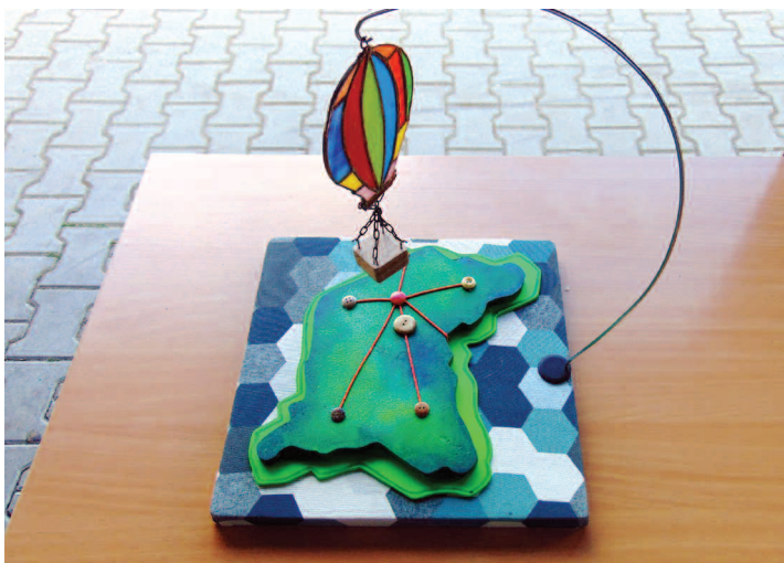
Praca Nasza piękna Wielkopolska autorstwa P.Antkowiaka i D.Kortyli