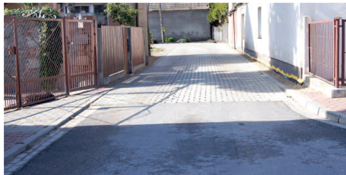
ul. Krótka w Podrzewiu