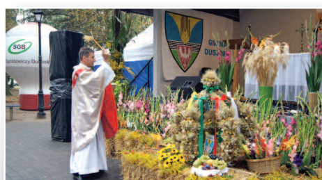
Święto Plonów w Dusznikach – str. 10-11