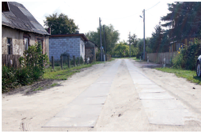
Droga z płyt betonowych w Zakrzewku

Trwają prace remontowe i budowlane w obiektach i na drogach gminnych. Część zaplanowanych w tegorocznym budżecie inwestycji została już zakończona i odebrana, pozostałe zostaną zrealizowane do końca października.