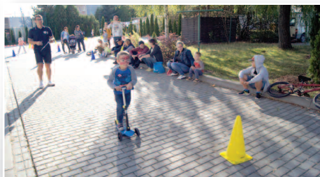
Dzień Małych Kółek w Dusznikach – str. 12