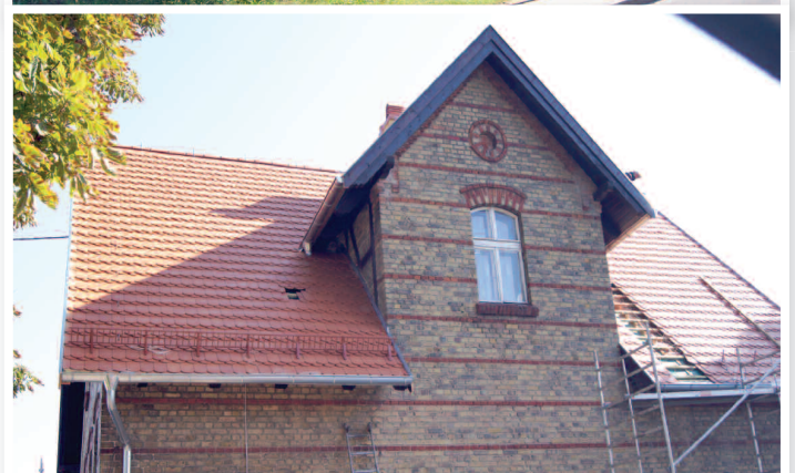
Remont dachu przedszkola w Sękowie