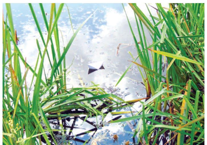
Fotografia Niebiańska podróż wśród trzcin autorstwa Agnieszki Pieprzyk