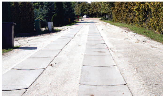
Droga z płyt betonowych na ul. Leśnej w Grzebienisku

py), w Sarbii (1 lampa) i w Sędzinku, ul. Topolowa (1 lampa). Wykonawcą inwestycji była firma Wichary TECHNIC z Zabrze, a łączny koszt realizacji umowy wyniósł 97 tys. zł.