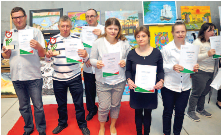
Uczestnicy konkursu z WTZ Duszniki

Uczestnicy Warsztatu Terapii Zajęciowej w Dusznikach wzięli udział w XVII edycji Ogólnopolskiego Konkursu Plastycznego „Sztuka Osób Niepełnosprawnych”. Organizator – Państwowy Fundusz Rehabilitacji Osób Niepełnosprawnych na tegoroczny temat wybrał hasło: „Podróże moich marzeń”.