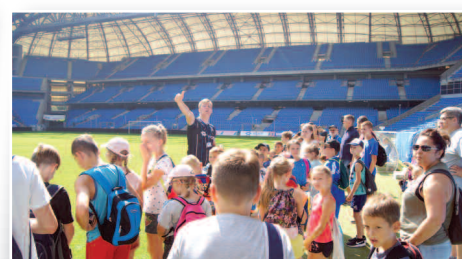
Młodzi kibice na poznańskim stadionie Lecha – str. 19