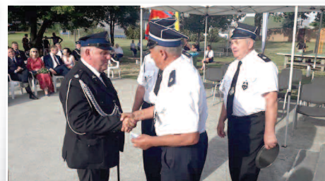
XIV Dni Sękowa i jubileusz OSP – str. 14-15