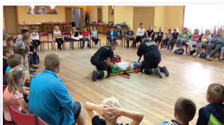
Gmina zorganizowała Zielone Wakacje dla dzieci – str. 17