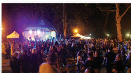
Powitanie lata w Dusznikach – str. 18