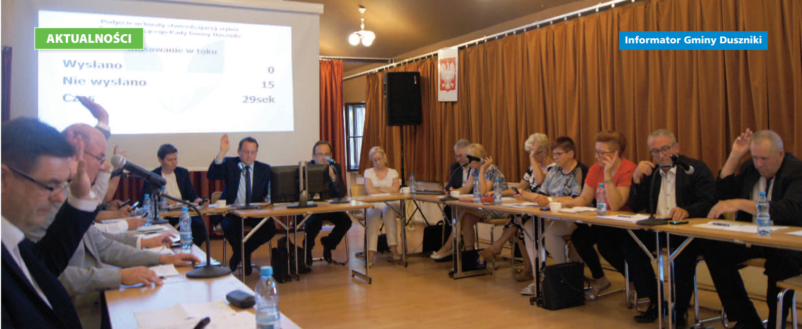
Sesja Rady Gminy Duszniki