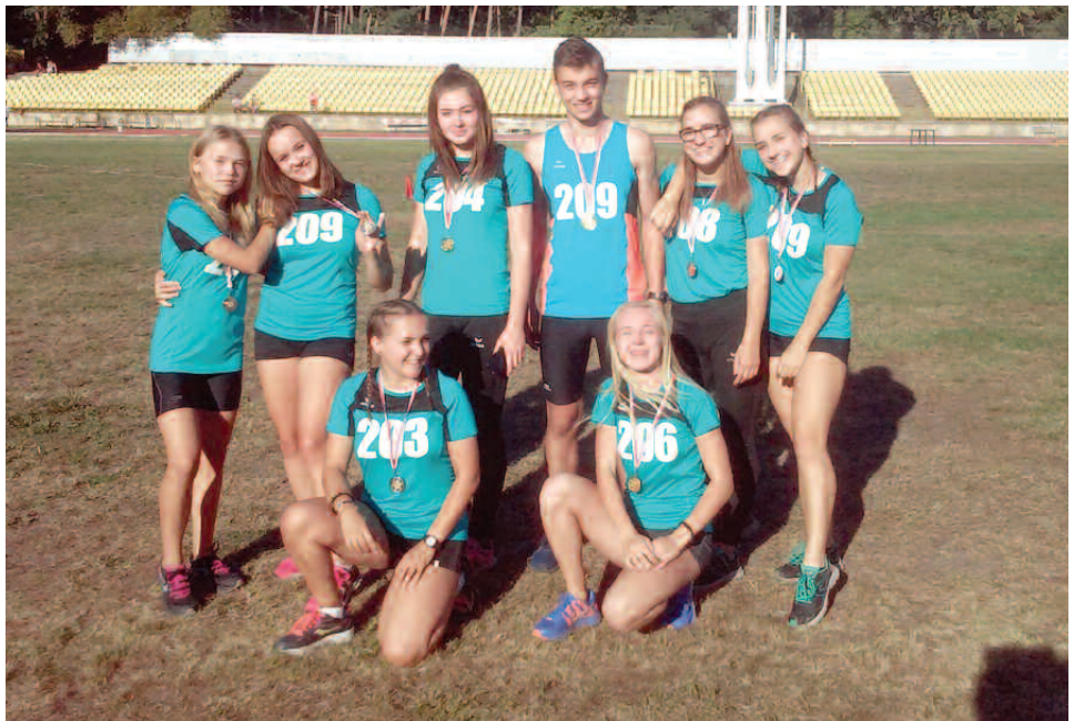
Stypendyści Gminy Duszniki. Sportowcy z UKS Olimp

W czerwcu br. wpłynęło do urzędu 71 wniosków, w tym 20 o stypendium sportowe, które przyznawane jest w czerwcu za najwyższe osiągnięcie zdobyte w całym minionym roku, oraz 51 za wysokie wyniki w nauce. Wszystkie wnioski zostały ocenione pozytywnie. Najwyższe stypendium sportowe wyniosło 1000 zł, a stypendium za wysoką średnią 450 zł. Najniższe kwoty przyznanych stypendiów wy-