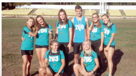
Wójt przyznał stypendia uzdolnionym uczniom i sportowcom – str. 5