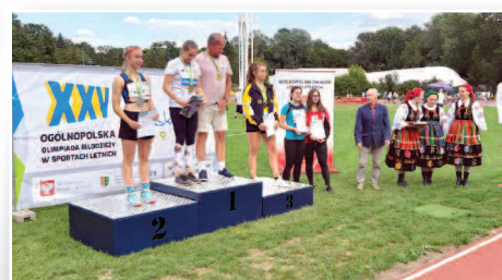
Zawodniczki UKS Olimp w Ogólnopolskiej Olimpiadzie – str. 19