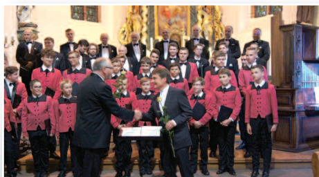
„Poznańskie Słowiki” w Dusznikach – str. 11