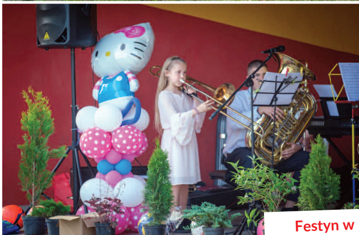
Festyn w Podrzewiu 8 czerwca