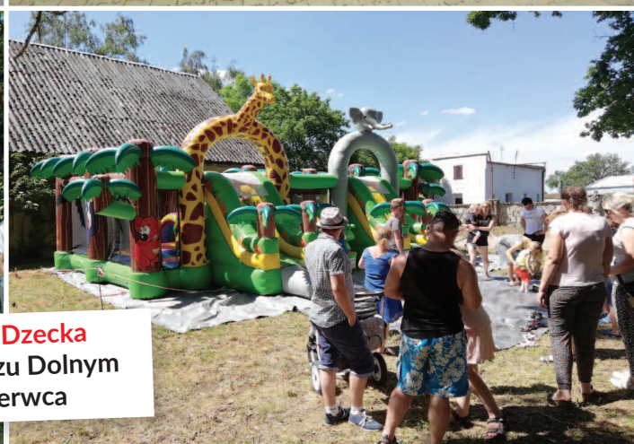
Dzień Dziecka w Ceradzu Dolnym 9 czerwca