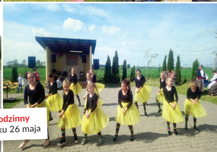
Piknik Rodzinny w Chętlinku 26 maja