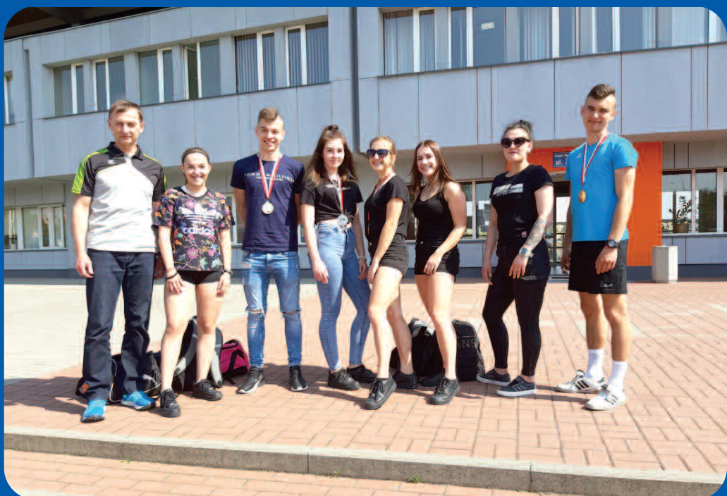
Mistrzostwa Wielkopolski LZS w Pile 25 kwietnia 2019 r.

Zawodnicy UKS Olimp Duszniki, bardzo udanie wystartowali w lekkoatletycznych zawodach okręgowych i wojewódzkich w nowym sezonie 2019. Pierwsze zawody odbyły się 25 kwietnia w Pile. Były to Mistrzostwa Wielkopolski Młodzieży Szkolnej LZS w kat. wiekowej 16-22 lat. W imprezie