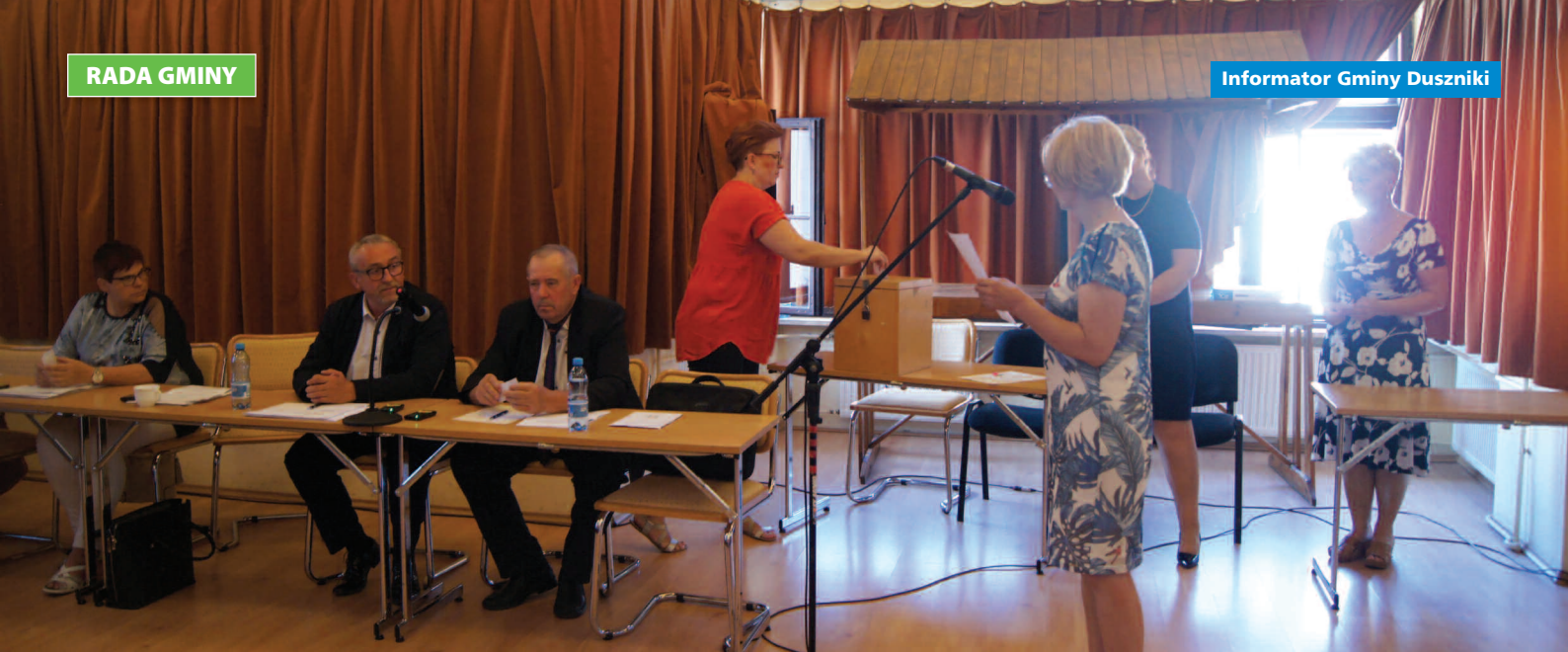
Głosowanie na Przewodniczącą Rady, 14 czerwca 2019 r.