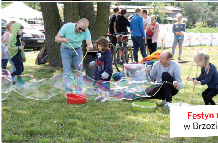
Festyn rodzinny w Brzozie 25 maja