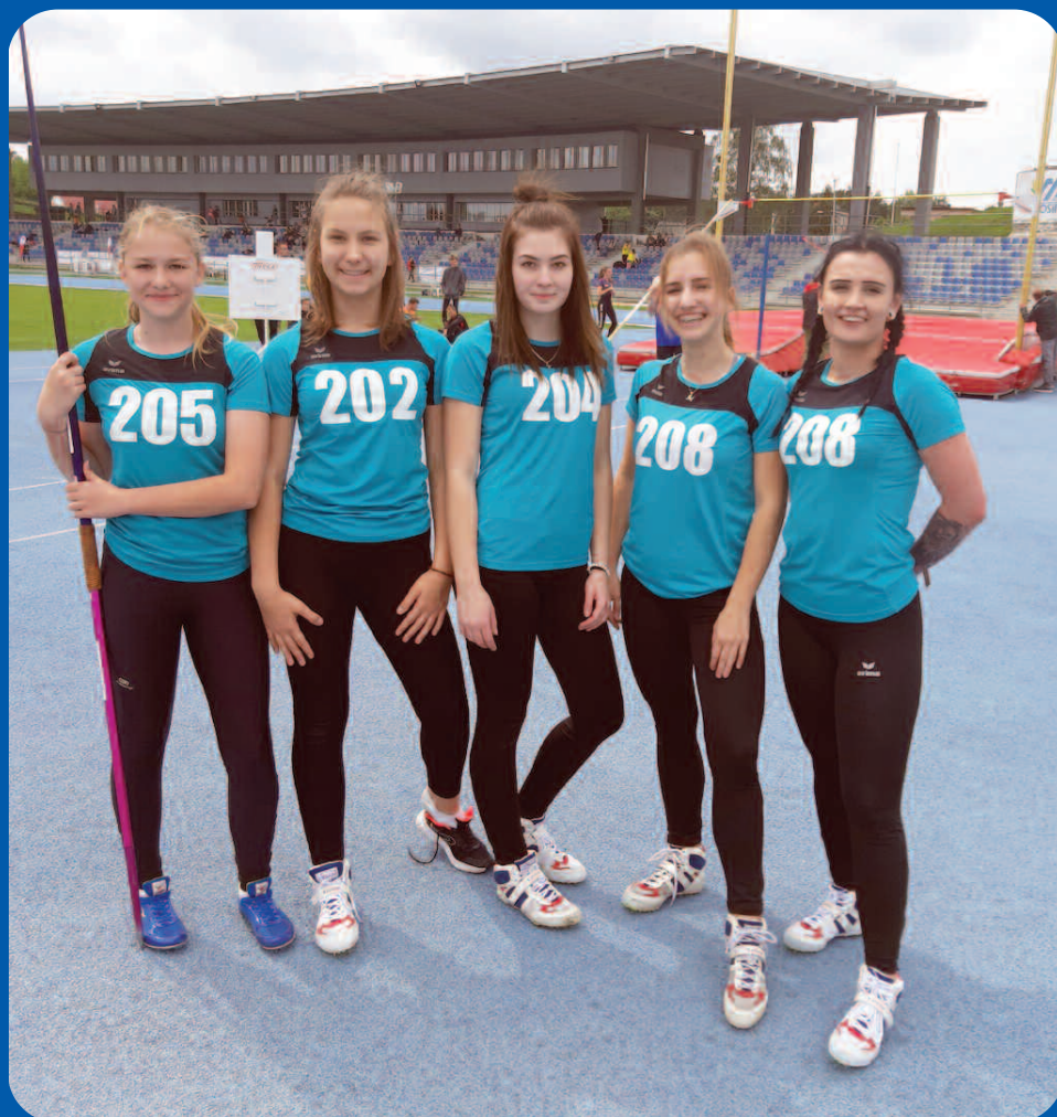
Mistrzostwa Wielkopolski juniorów w Pile 25 maja 2019 r.

Tekst: na podstawie informacji z UKS Olimp