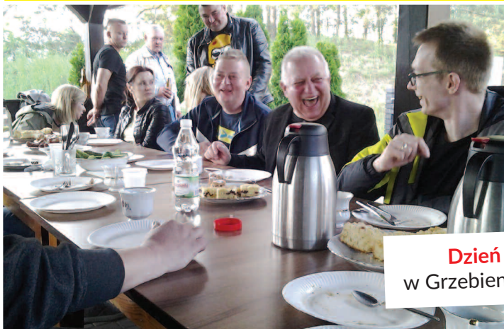
Dzień Sąsiada w Grzebienisku 25 maja