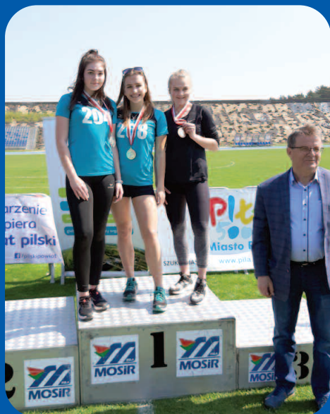
Mistrzostwa Wielkopolski LZS w Pile 25 kwietnia 2019 r.

Zawodnicy UKS Olimp Duszniki, bardzo udanie wystartowali w lekkoatletycznych zawodach okręgowych i wojewódzkich w nowym sezonie 2019. Pierwsze zawody odbyły się 25 kwietnia w Pile. Były to Mistrzostwa Wielkopolski Młodzieży Szkolnej LZS w kat. wiekowej 16-22 lat. W imprezie