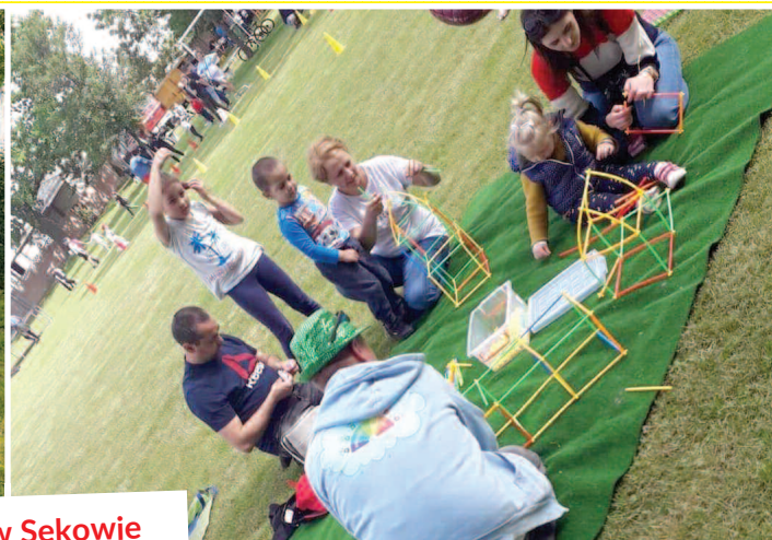
Festyn w Sękowie 25 maja