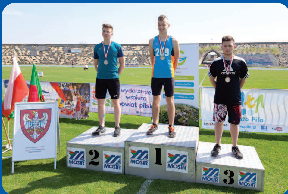
Mistrzostwa Wielkopolski LZS w Pile 25 kwietnia 2019 r.