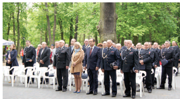
Uroczystości obchodów Dnia Strażaka w Dusznikach - 11 maja br.

W maju radni uczestniczyli w oficjalnych uroczystościach organizowanych w Dusznikach: 3 maja w obchodach Święta Konstytucji 3 maja przy pomniku Walk i Męczeństwa, a 11 maja br. w uroczystości Dnia Strażaka w dusznickim parku.