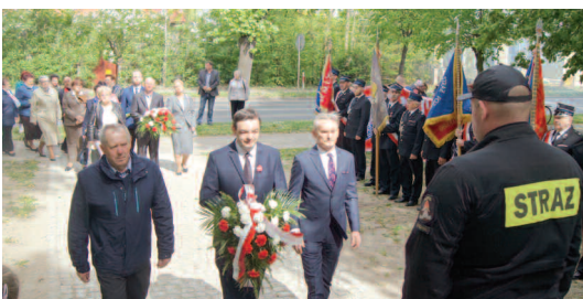
Złożenie kwiatów pod pomnikiem Walk i Męczeństwa w Dusznikach - 3 maja br.