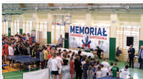
Memoriał Kazimierza Bartosza – str. 16, 17