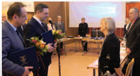
Dyrektor BPiCAK przechodzi na emeryturę – str. 6