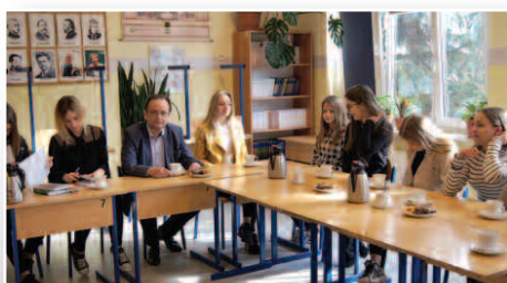
Robocze spotkanie Rady Młodzieży – str. 10