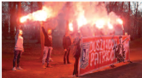
Obchody Narodowego Dnia Pamięci „Żołnierzy Wyklętych” – str. 11