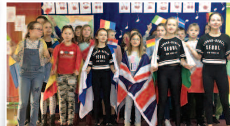
Dzień Austriacki w Szkole Podstawowej w Dusznikach – str. 12, 13