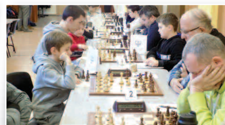
Otwarte Mistrzostwa Gminy Duszniki w szachach – str. 19