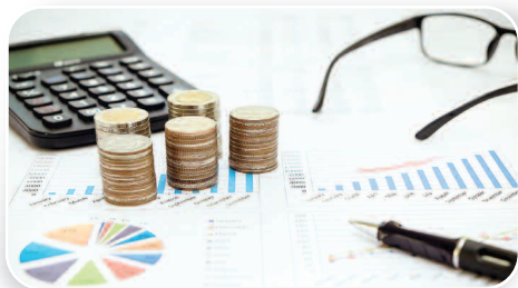
BUDŻET GMINY DUSZNIKI 2019 - str. 3