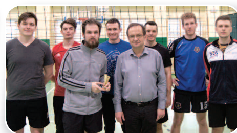
Orkiestrowy Turniej Siatkówki - str. 19