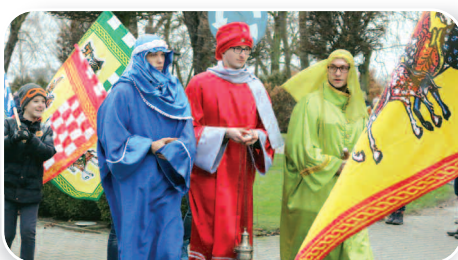
Orszak Trzech Króli 2019 - str. 15