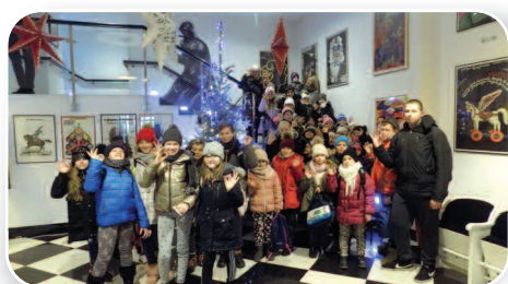
Ferie z biblioteką - str. 13