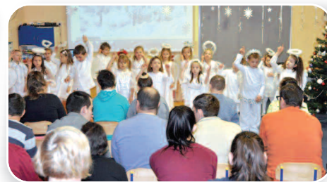
Anielskie przedstawienie - str. 12