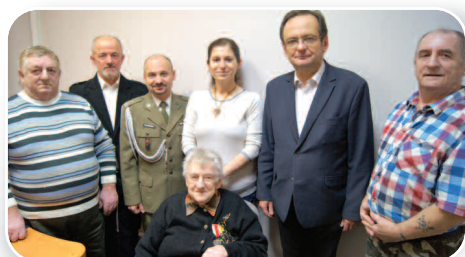
Medal za zasługi dla obronności kraju dla mieszkanki gminy - str. 13