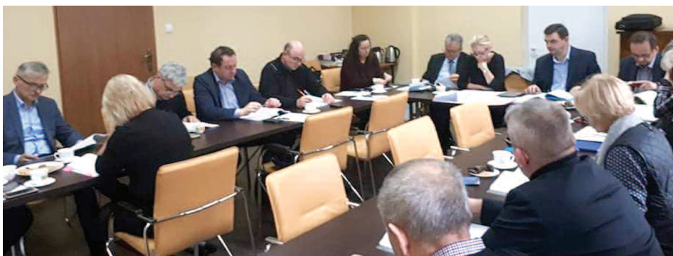
Wspólne posiedzenie komisji w sprawie projektu budżetu na 2019 rok