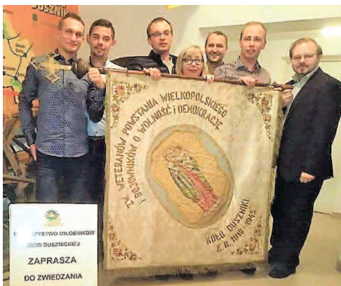
Członkowie Koła z zabytkowym sztandarem, wypożyczonym z Muzeum Zamek Gorków