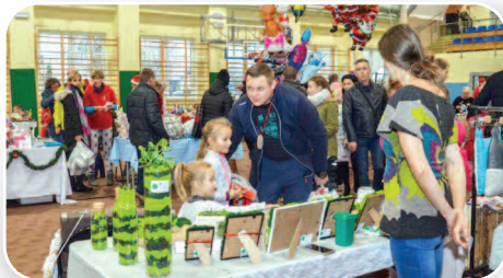
Jarmark Bożonarodzeniowy w Dusznikach - str. 10-11