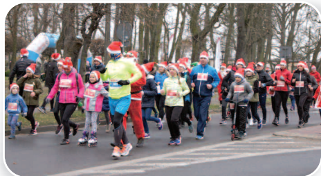
Mikołajkowe święto sportu - str. 8-9