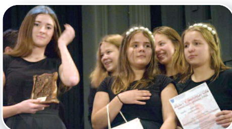
Złoty Mikrofon dla Cynamonu z Grzbieńska - str. 14