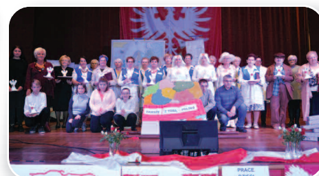
Zawsze z Tobą Polsko - str. 15