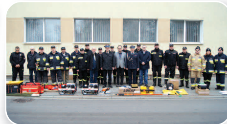
Nowy sprzęt dla jednostek OSP - str. 12