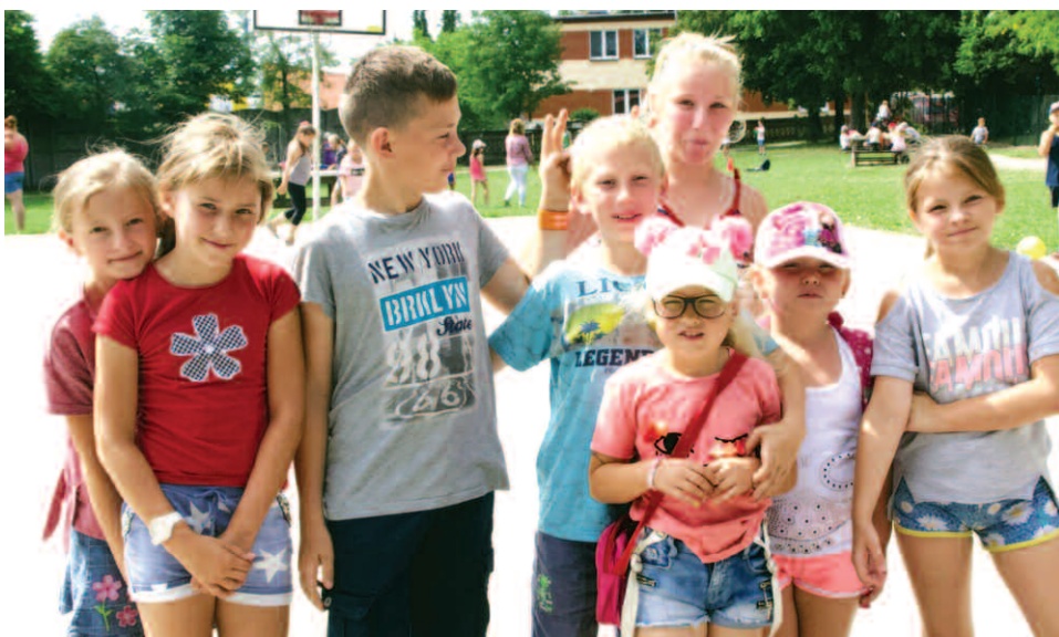
Zielone Wakacje w Podrzewiu