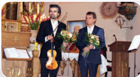
Koncert Organowy – str. 19