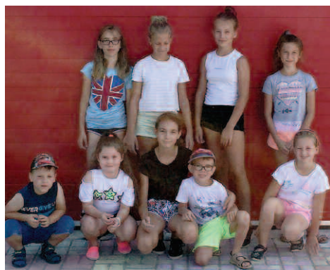
Zielone Wakacje w Niewierzu