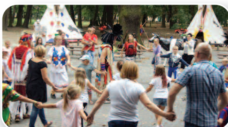
Wioska Indiańska – str. 16