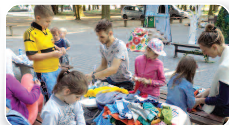
Teatr w małym mieście – str. 17