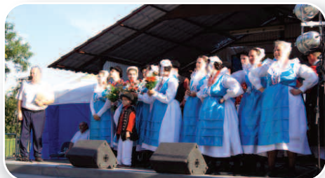
Jubileuszowe Dni Sękowa – str 10-11