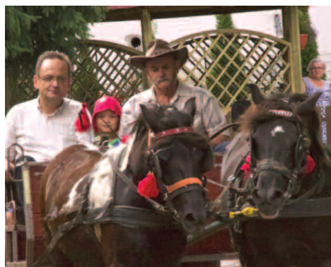
Przejazdy bryczką w Podrzewiu

na Komisja Rozwiązywania Problemów Alkoholowych w Dusznikach przy wsparciu pracowników jednostek gminnych i urzędu.