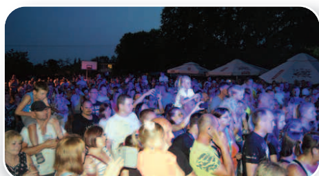
Dni Podrzewia – str. 12-13

sobota, 8 września godzina 16.00 park w Dusznikach