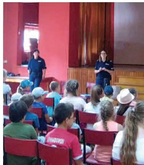
Zajęcia z Policją

Słoneczna pogoda sprzyjała aktywności na świeżym powietrzu, grze w piłkę, sportowym konkurencjom, czy tworzeniu kolorowych malowideł, jak to miało miejsce w Niewierzu. Każda grupa miała również okazję wyjechać na ciekawą wycieczkę, m.in. do „Frajda Park” i „Jump Arena” w Poznaniu, czy też do „Dzieje Park” w Murowanej Goślinie. W Grzebienisku zorganizowano pogadankę o bezpieczeństwie, którą poprowadziły funkcjonariuszki Policji z Dusznik i Szamotuł. W organizację zajęć i atrakcji dla dzieci włączyli się też strażacy z miejscowych jednostek. Uczestników zajęć odwiedził również wójt, który miał okazję skorzystać z atrakcji zorganizowanej przez sołtysa Podrzewia – przejazdu bryczką. Tegoroczne Zielone Wakacje cieszyły się sporym zainteresowaniem. W Grzebienisku i w Podrzewiu uczestniczyło średnio nawet po 60 dzieci. Organizatorzy zapewнили dowozy i odwozy dzieci z pozostałych miejscowości, które chciały wziąć udział w zajęciach. Organizacją Zielonych Wakacji zajęła się Gmin-