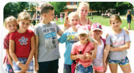
Zielone Wakacje – str. 18