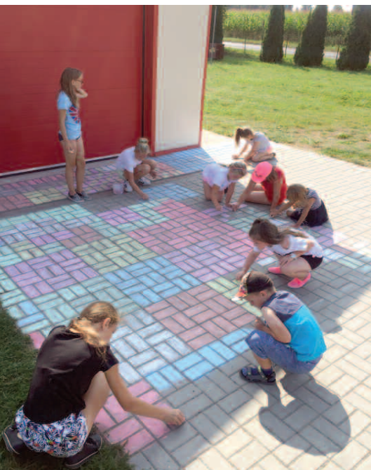
Kolorowa mozaika w Niewierzu