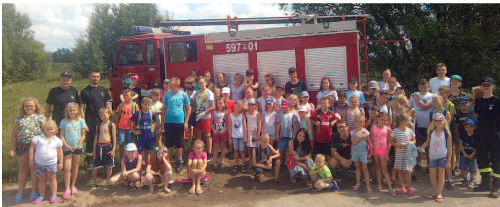
Zielone Wakacje w Grzebienisku

W lipcu i w sierpniu w czterech miejscowościach Gminy Duszniki odbyły się dwutygodniowe turnusy Zielonych Wakacji. W salach wiejskich w Podrzewiu, Grzebienisku, Niewierzu i Sędzinie dzieci miały zagwarantowaną opiekę i ciekawe zajęcia.