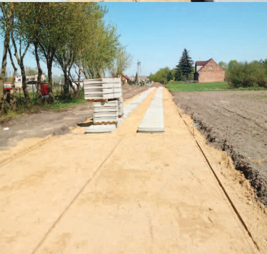
Budowa drogi z płyt betonowych na ul. Sportowej w Podrzewiu