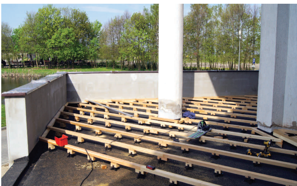
Remont tarasu CAK w Dusznikach