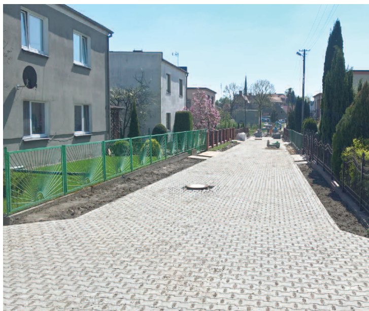
Remont drogi Oś. Spółdzielców w Wilczyń