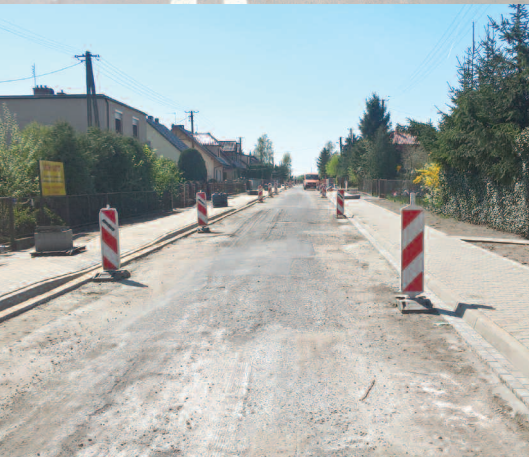
Remont ul. Lipowej w Dusznikach