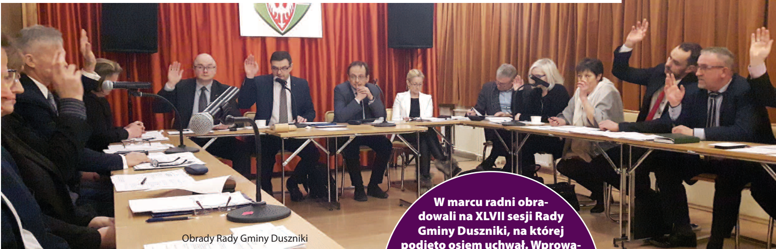
Obrady Rady Gminy Duszniki

Przyjęto „Program opieki nad zwierzętami bezdomnymi oraz zapobiegania bezdomności zwierząt na terenie Gminy Duszniki w 2018 r.”. W związku ze zmianą przepisów w Kodeksie Wyborczym, które będą obowiązywały już podczas tegorocznych wyborów samorządowych, konieczne było podjęcie uchwał określających okręgi wyborcze oraz obwody głosowania. Radni podjęli również długo oczekiwaną przez sportowców uchwałę, na podstawie której przyznawane będą stypendia sportowe, nagrody i wyróżnienia za osiągnięte wyniki we współzawodnictwie sportowym.