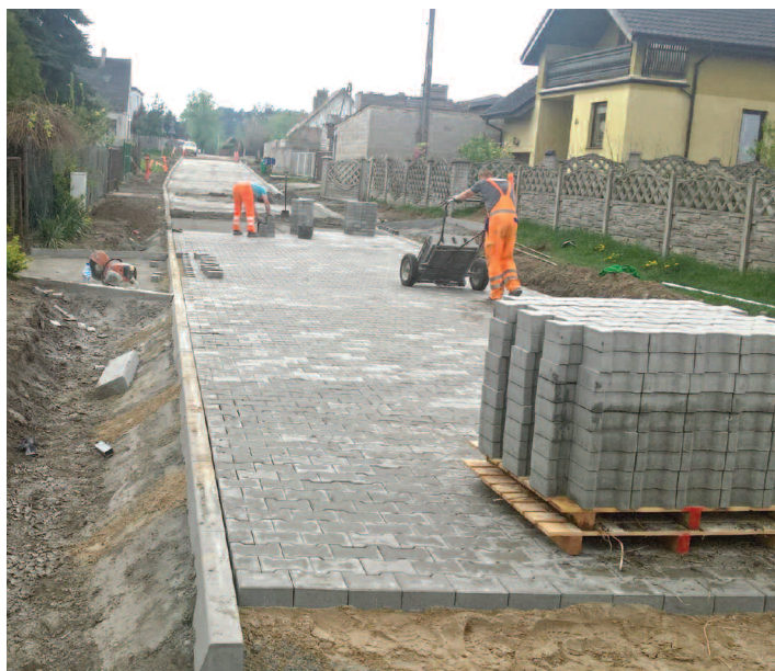
Remont ul. Kasztanowej w Grzebienisku

Trwają prace remontowe i budowlane na drogach gminnych. O szczegółach poszczególnych inwestycji, ich kosztach, zakresie i wykonawcach prac pisaliśmy w poprzednim, kwietniowym wydaniu Informatora („Gmina Duszniki rusza z remontami dróg”, Nr 32, str. 4-5). Wkrótce zakończą się prace budowlane w budynku Centrum Animacji Kultury w Dusznikach. Powstanie tam taras, który będzie wykorzystywany do organizacji imprez kulturalnych i koncertów. Z sali widowiskowej zostanie wykonane wyjście bezpośrednie na taras. Postępy w pracach i ich aktualny stan przedstawiamy na zdjęciach.