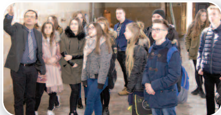
Aktywne posiedzenie Rady Młodzieży, str. 12