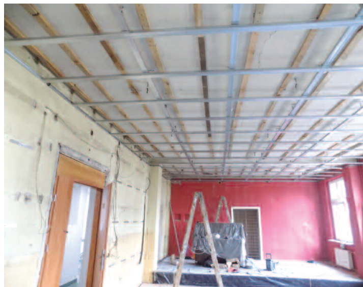
wykonanie podwieszanego sufitu oraz zamontowanie płyt gipsowo-kartonowych.

Na początku marca rozpoczął się remont sali kameralnej w budynku Centrum Animacji Kultury w Dusznikach (sala nad pocztą). Zakres prac obejmuje m.in.: demontaż i prace rozbiórkowe starej boazerii, wymiana instalacji elektrycznej,