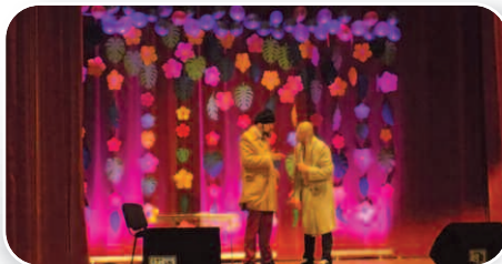
Kabaretowy Dzień Kobiet, str. 17