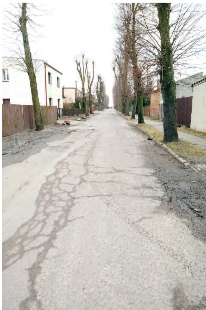
ul. Lipowa w Dusznikach przed remontem

Wiele dróg gminnych, szczególnie po okresie zimowym, wymaga prac naprawczych. Mieszkańcy z niecierpliwością oczekują remontu ulic, które potrzebują poważnych inwestycji i przebudowy. Te pilne i najbardziej oczekiwane zadania zostały ujęte w tegorocznym budżecie. Pisaliśmy o nich w poprzednim wydaniu Informatora (Nr 31 marzec 2018, Najważniejsze zadania inwestycyjne w 2018 r., str. 5).