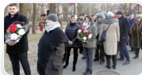
Pamięć o „Żołnierzach Wyklętych”, str. 19