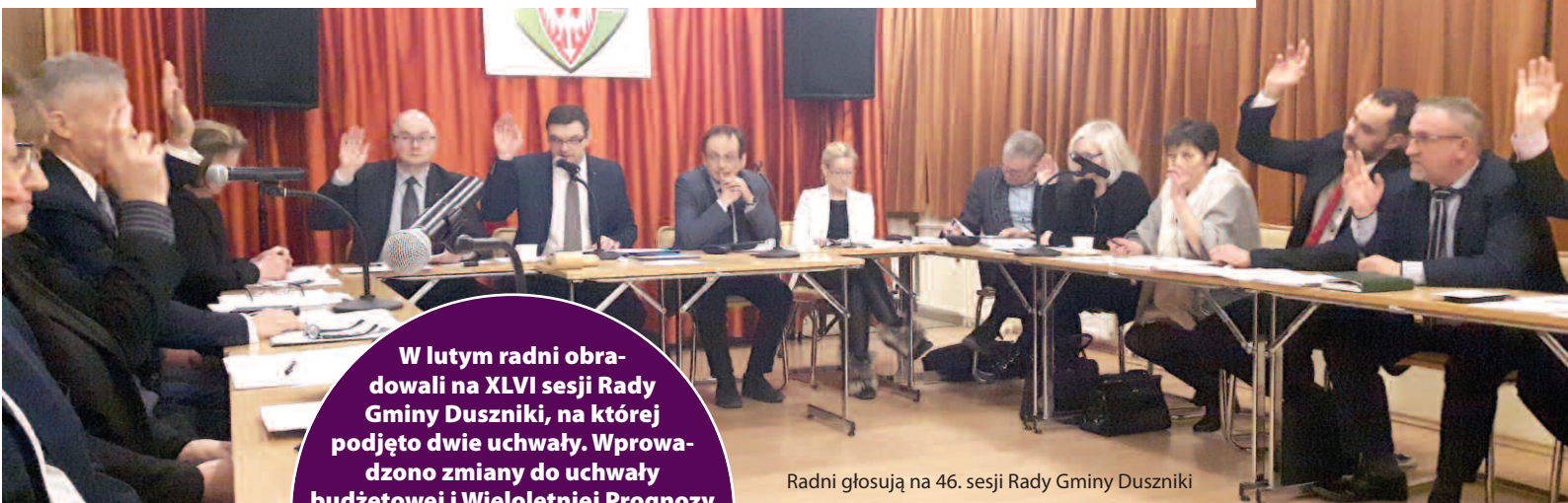
Radni głosują na 46. sesji Rady Gminy Duszniki

W lutym radni obradowali na XLVI sesji Rady Gminy Duszniki, na której podjęto dwie uchwały. Wprowadzono zmiany do uchwały budżetowej i Wieloletniej Prognozy Finansowej, które są naturalną konsekwencją realizacji budżetu i wynikały tym razem głównie ze zmian w poziomach dotacji oraz zmian w kosztach zaplanowanych inwestycji.