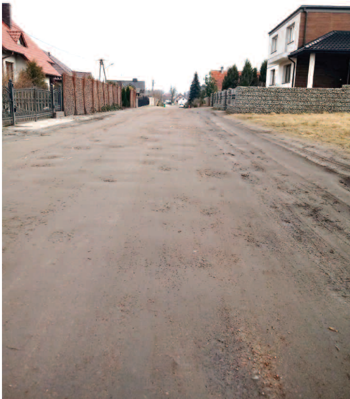
ul. Kasztanowa w Grzebienisku przed remontem