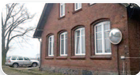
Otwarcie nowej świetlicy wiejskiej w Grodziszczku, str. 17