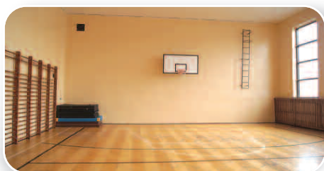
Remont sali sportowej w Dusznikach, str. 8