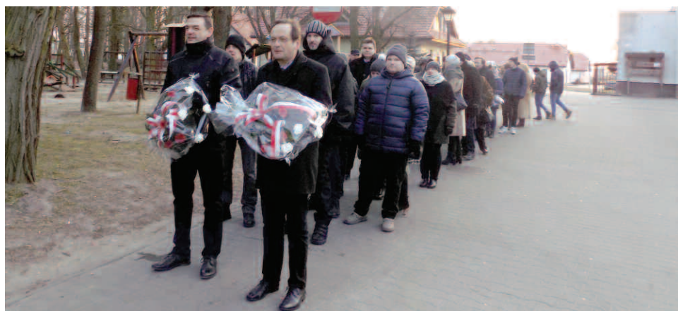
Przewodniczący Rady podczas obchodów Dnia Żołnierzy Wyklętych

Kontakt do radnych zapewnia również biuro Rady w Urzędzie Gminy Duszniki: 61 29 19 075, rada@duszniki.eu