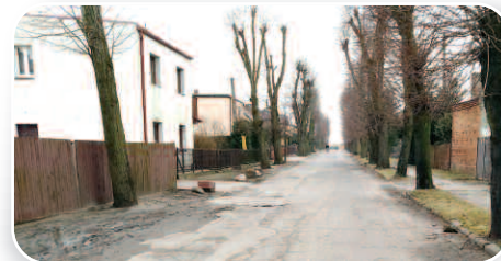
Gmina Duszniki rusza z remontami dróg, str. 4-5