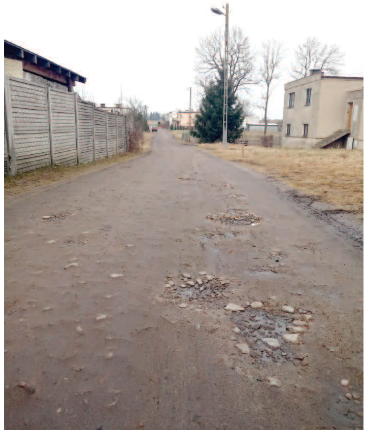
Osiedle Spółdzielców w Wilczynie przed remontem