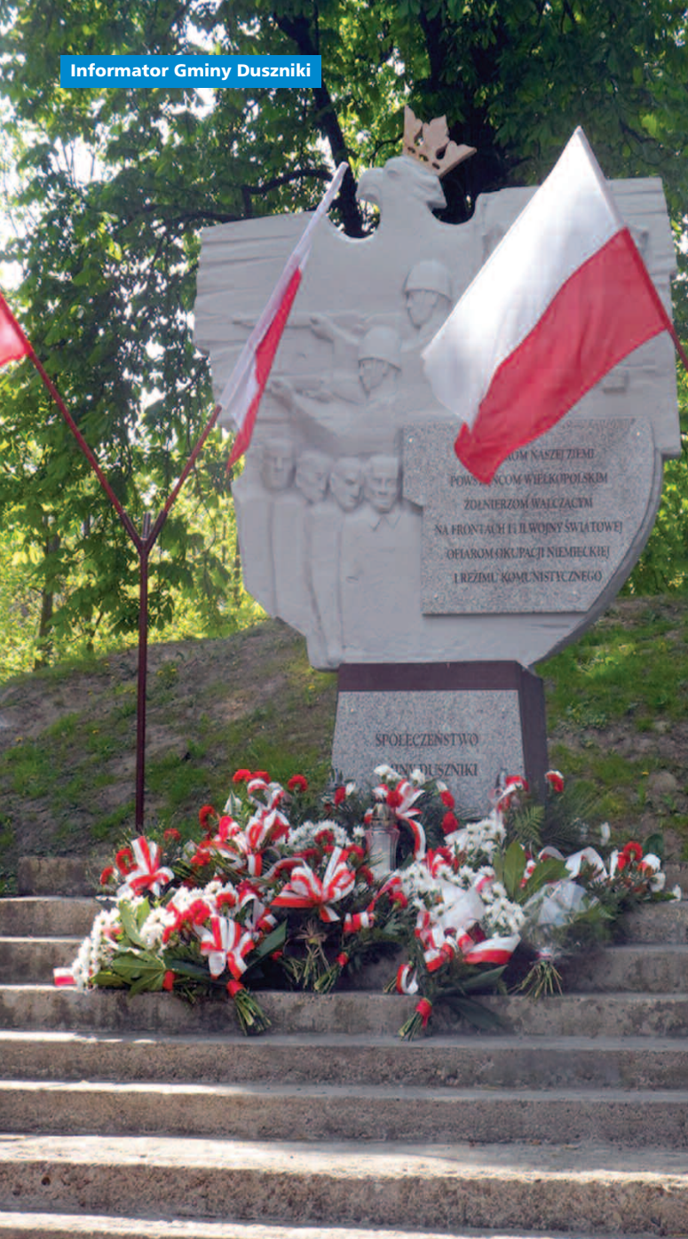
Pomnik Walk i Męczeństwa w Dusznikach (zdjęcie archiwalne, wykonane w 2016 roku po odrestaurowaniu pomnika)