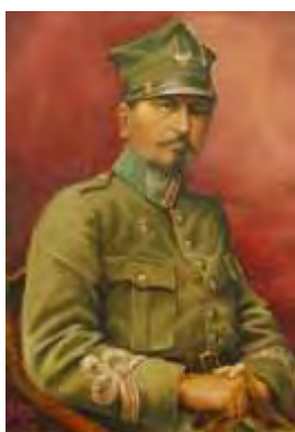
gen. Józef Dowbor Muśnicki

26 grudnia 1918 roku na zaproszenie delegacji Naczelnej Rady Ludowej przybył do Poznania Ignacy Jan Paderewski, światowej sławy kompozytor i muzyk oraz wielki orędownik sprawy polskiej na Zachodzie. Wyłączenie w mieście prądu i próba zakazu wizyty Paderewskiego w Poznaniu nie odniosły skutku – znakomity gość i jego towarzysze zostali entuzjastycznie przewiezieni do Hotelu Bazar. Jeszcze tego dnia na domach Poznaniaków pojawiły się różnobarwne flagi: polskie, brytyjskie i amerykańskie. Paderewski przemawiał do zgromadzonych licznie Polaków, a następnego dnia - 27 grudnia 1918 roku w godzinach rannych pod okna Bazaru przyszło ponad 10 000 dzieci polskich z chorągiewkami w rękach.