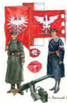
Mundury Armii Powstania Wielkopolskiego