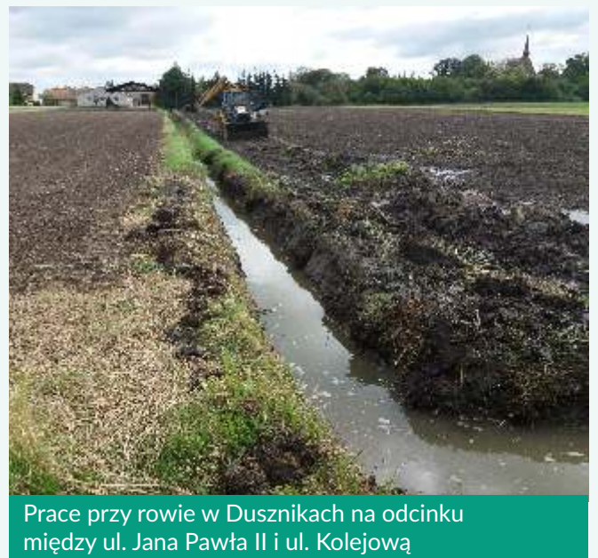
Prace przy rowie w Dusznikach na odcinku między ul. Jana Pawła II i ul. Kolejową