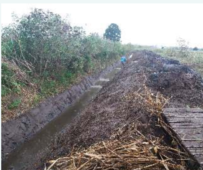
Prace na odcinku od ul. Kolejowej do oczyszczalni