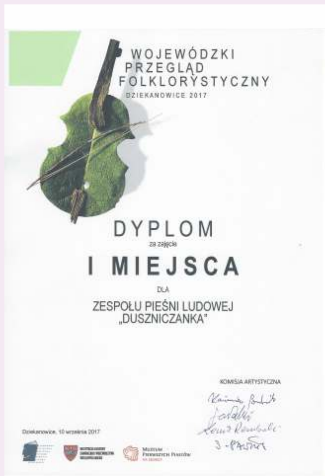
Dyplom dla Duszniczanki