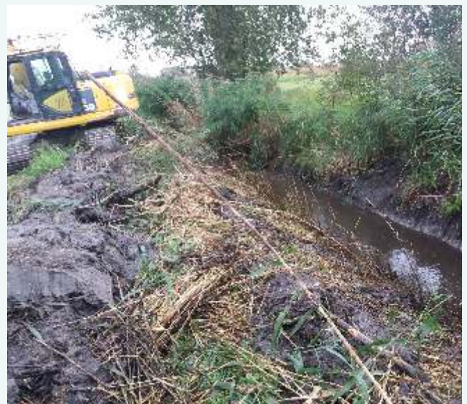
Prace przy konserwacji rowu od Mogilnicy do Wierzei