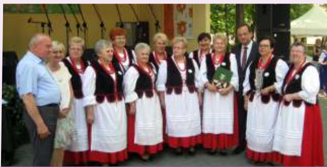
Duszniczanka na Przeglądzie w Dusznikach w 2016 r.