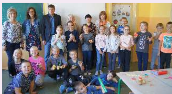
Zajęcia plastyczne w szkole w Grzebienisku

W czasie pobytu w Gminie Duszniki delegacja z Estonii miała również okazję odwiedzić Warsztat Terapii Zajęciowej i przedszkole w Dusznikach. (red.)