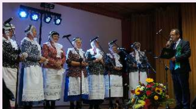
Życzenia jubileuszowe dla Podrzewianki podczas tegorocznych dożynek gminnych