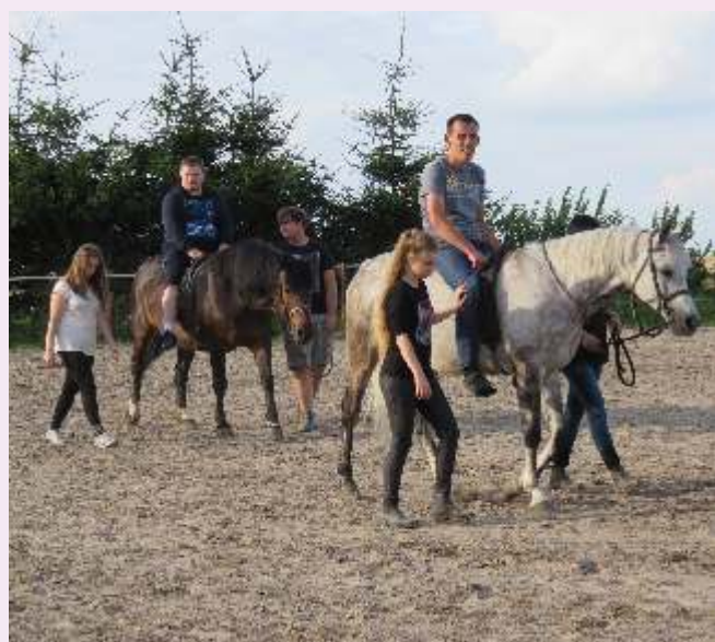
Zajęcia z hipoterapii