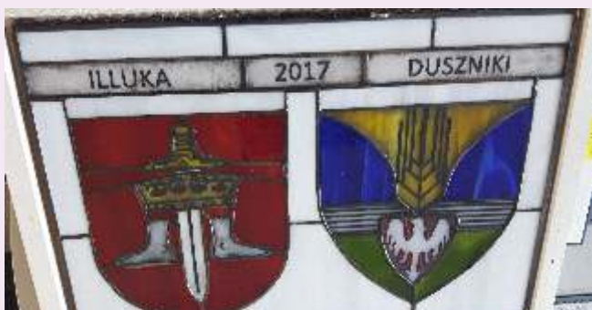
Witraż подарowany Illuce

O tych problemach i o niepewności co do możliwości prowadzenia dalszej współpracy pomiędzy Dusznikami i Illuką rozmawiano właśnie na spotkaniu w Ambasadzie. Ambasador podkreślał wyjątkowość wspólnych działań pomiędzy naszymi gminami i unikatowy charakter naszych relacji. Zapewnił, że w interesie zarówno obu samorządów i ich społeczności, jak i obu krajów, leży rozwój tej współpracy a nie jej zakończenie i zaapelował do władz Illuki, aby bez względu na ostateczne decyzje starały się przekonywać do kontynuacji tego partnerstwa.