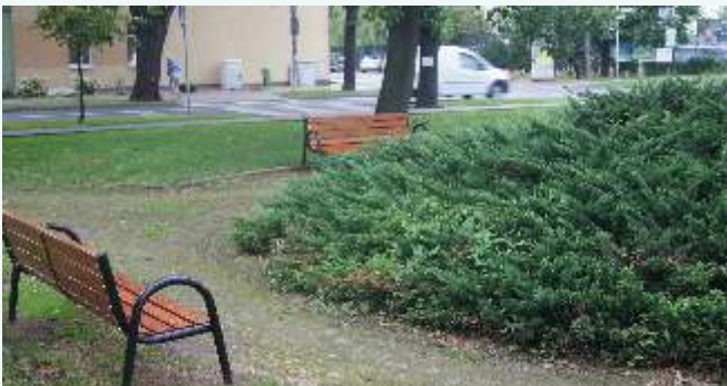
Skwer naprzeciw urzędu