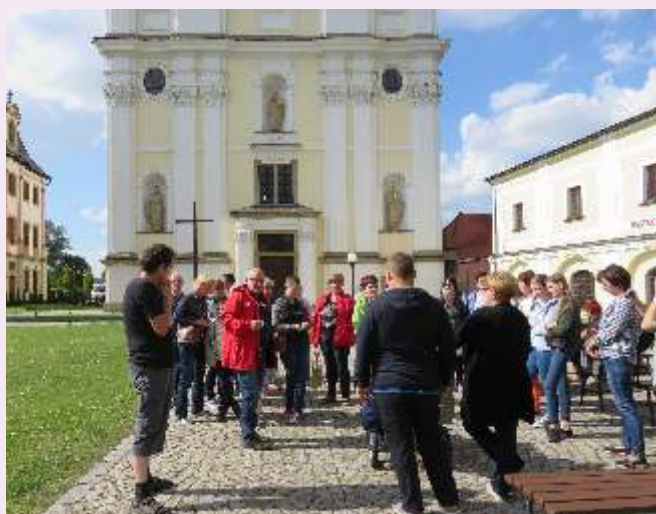
Podopieczni Duszka z rodzinami na wycieczce

Stowarzyszenie na rzecz Dzieci i Młodzieży Niepełnosprawnej DUSZEK zorganizowało dla swoich podopiecznych zajęcia z hipoterapii. W Harmony Farm w Szewcach k. Buku spotykano się w czerwcowe i lipcowe piątki. Zajęcia cieszyły się dużym powodzeniem i sprawiły uczestnikom moc radości. Hipoterapia jest wyjątkową i niepowtarzalną metodą usprawniania dzięki obecności konia. Jego ruch daje nowe i niespotykane w innych metodach możliwości terapeutyczne. Bardzo ważny jest kontakt ze zwierzęciem, który wspomaga rozwój samodzielności, wzmacnia poczucie własnej wartości. Jest jedną z form rehabilitacji wieloprofilowej, czyli oddziałującej jednocześnie ruchowo, sensorycznie, psychicznie i społecznie.