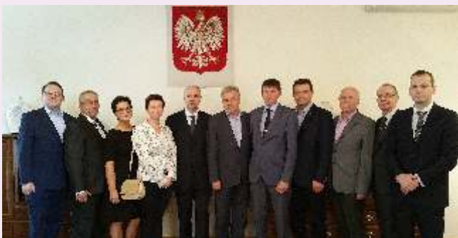
Spotkanie z Ambasadorem