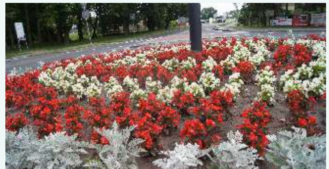
Nasadzenia na rondzie w Dusznikach