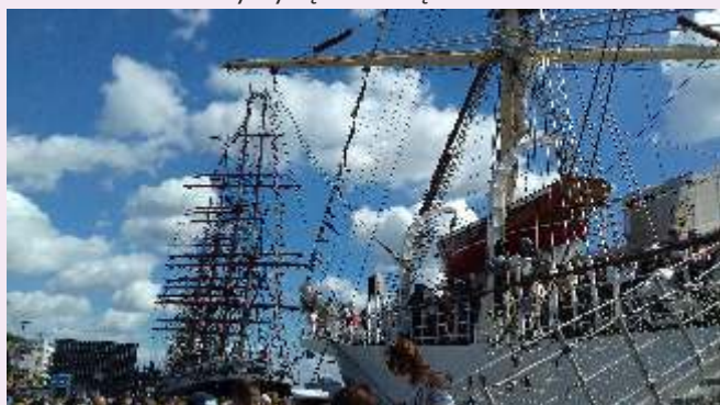
Złot żaglowców w Szczecinie

W pierwszych dniach lipca zgodnie już ze swoją tradycją, Stowarzyszenie DUSZEK zorganizowało wycieczkę dla członków i podopiecznych. W tym roku była to Jedlina-Zdrój. W ciągu czterech dni można było przy okazji zwiedzić Sanktuarium Krzeszów, Zamek Grodno i Książ oraz pospacerować po mieście Kłodzko. Taki wyjazd i przebywanie w obcym środowisku daje możliwości realizacji wsparcia rozwoju osób niepełnosprawnych przede wszystkim w zakresie komunikacji, przełamywania barier, nabywanie pewności siebie i umiejętności społecznych, stymulowanie zainteresowań turystyką i historią.