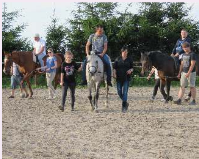
Zajęcia z hipoterapii

W dniach 5-8 sierpnia 2017 w Szczecinie odbywał się Światowy Złot Żaglowców The Tall Ships Races. Stowarzyszenie DUSZEK z tej okazji zabrało członków i podopiecznych w rejs (wprawdzie autokarem, a nie żaglowcem), aby z bliska przyjrzeć się tym pięknym statkom. Osoby z niepełnosprawnością nie uczestniczą aktywnie w życiu społecznym nie mówiąc już o jakichkolwiek formach wypoczynku, a turystyka i rekreacja jest ważnym elementem rehabilitacji. Poznawanie nowych miejsc i ludzi podnosi świadomość i wiedzę, ma ogromny wpływ na dalsze funkcjonowanie osób z niepełnosprawnością. Realizacja zadania jest jedną z niewielu możliwości, gdzie osoby z niepełnosprawnością z naszej gminy mogą wziąć udział w wyjeździe.