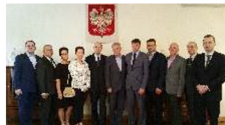
Spotkanie z Ambasadorem