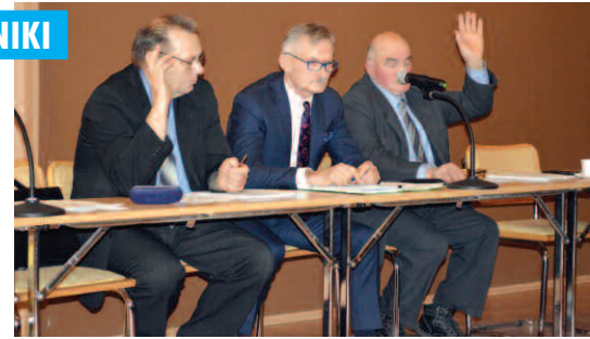
Głosowanie nad przyjęciem budżetu gminy na 2018 rok

Listopadowa sesja była również okazją do zapoznania się radnych z realizacją zadań oświatowych w poprzednim roku szkolnym