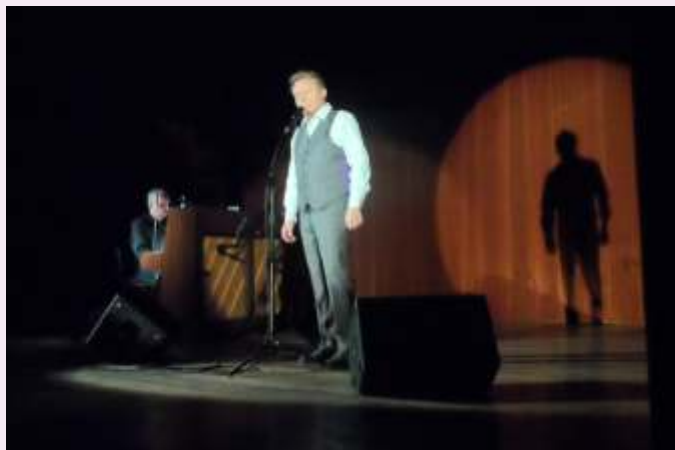
Recital Michała Bajora

Po recitalu, byli i obecni pracownicy oraz osoby wspierające biblioteczne inicjatywy podczas kameralnego spotkania zostali wyróżnieni pamiątkowymi upominkami będącymi wyrazami podziękowań za ich pracę i zaangażowanie na rzecz upowszechniania czytelnictwa i kultury. Bo to właśnie oni tworzyli i tworzą jakże ważną instytucję życia publicznego.