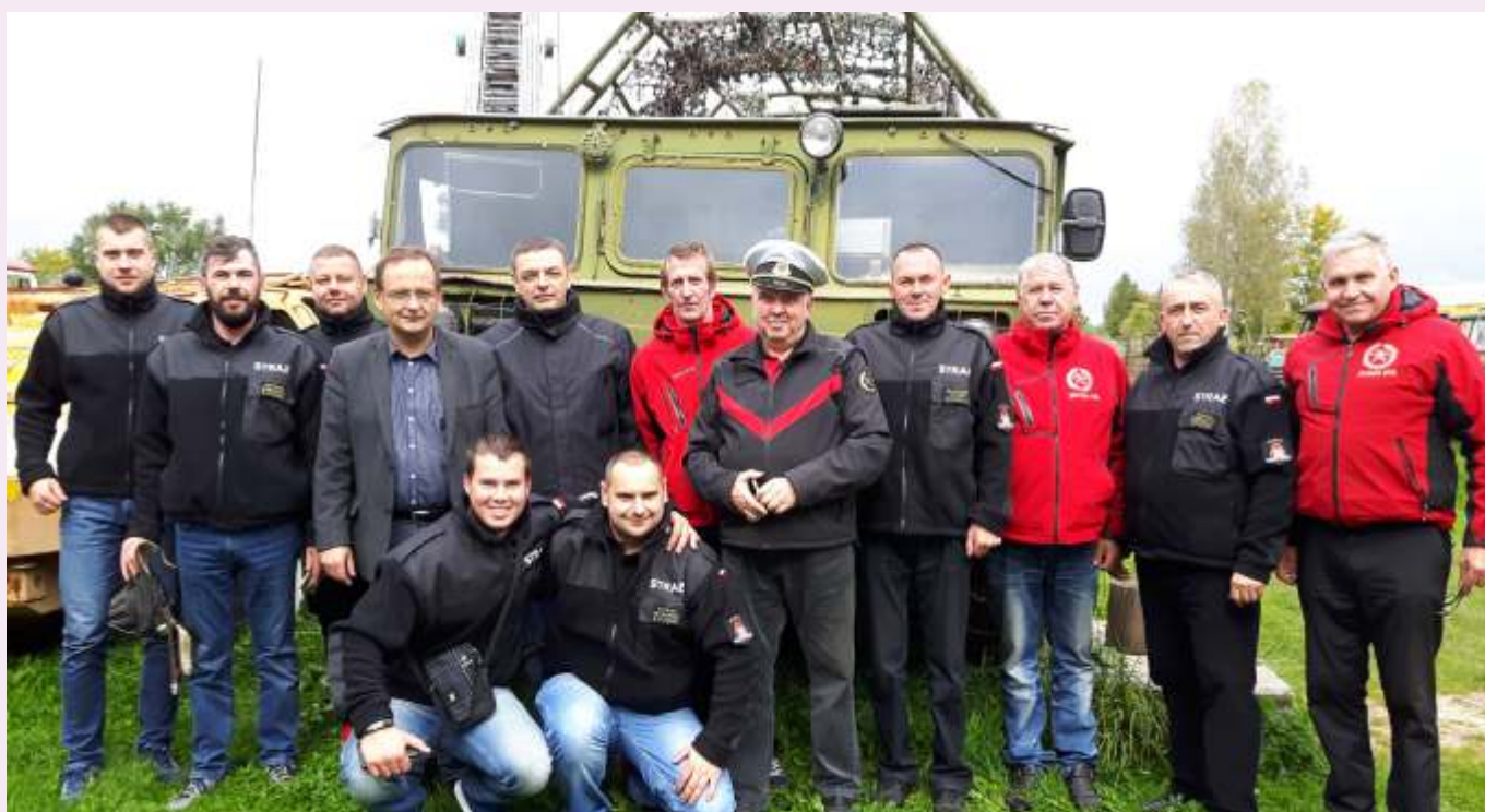
W muzeum w Järva-Jaani