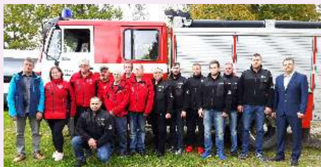
Ze strażakami z OSP Jaama