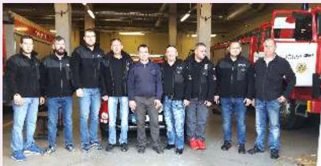
W bazie państwowych służb ratownictwa w Johvi