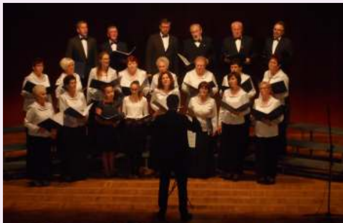
Koncert Chóru HALKA

1 października to data oficjalnego Międzynarodowego Dnia Muzyki. Święto zostało ustanowione w 1975 roku z inicjatywy Yehudiego Menuhina, ówczesnego prezydenta Międzynarodowej Rady Muzyki UNESCO. Głównym celem owego dnia jest przedstawienie muzyki w taki sposób, by była kojarzona jako dobro ludzkości oraz promocja muzyków jako tych, którzy tworzą niepowtarzalne piękno. Dlatego też, aby uczcić wspomniane święto, w wielu miejscach w Polsce odbyły się ciekawe wydarzenia muzyczne. Również Duszniki, jak co roku, włączyły się w uświetnienie tego dnia muzyką chóralną. Duszniczanie mieli okazję posłuchać oraz zaśpiewać przepiękne pieśni, które przygotowały Chóry: Halka z Dusznik i Lira z Pniew oraz Koło Śpiewu im. Feliksa Nowowiejskiego z Tarnowa Podgórnego. Koncert zorganizowali: Chór „Halka” oraz Biblioteka Publiczna i Centrum Animacji Kultury w Dusznikach.