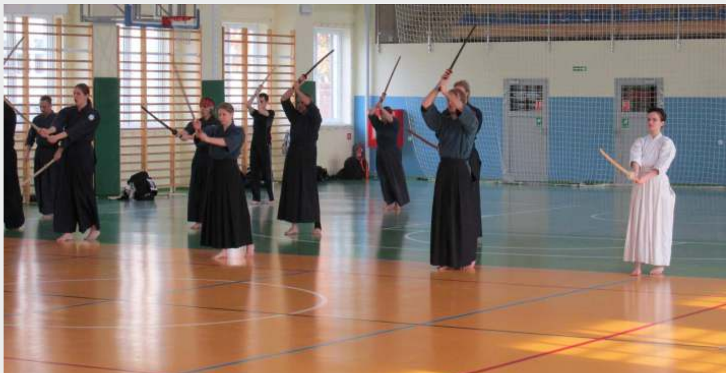
Pierwsze Dusznickie Gasshuku Nihon Kendo Kata

zajęć ciężko trenowali, aby podnieść swoje umiejętności, a część z nich zdawała egzaminy na poszczególne stopnie w hierarchii tej dyscypliny. Zachęcamy i zapraszamy na zajęcia Kendo odbywające się w sali OSiR w Dusznikach. Treningi prowadzone są w każdy poniedziałek od 18.30 do 20.00. Informacje i zapisy pod nr 601 885 338.