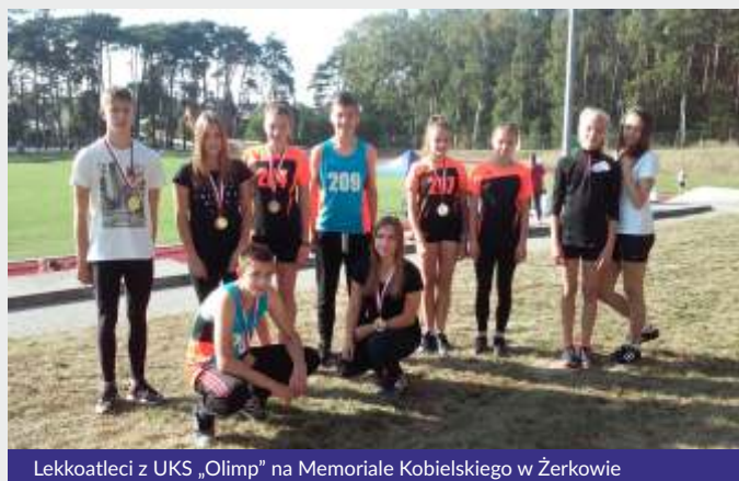
Lekkoatleci z UKS „Olimp” na Memoriale Kobielskiego w Żerkowie

Tekst i zdjęcia: Krzysztof Pluciński, UKS OLIMP