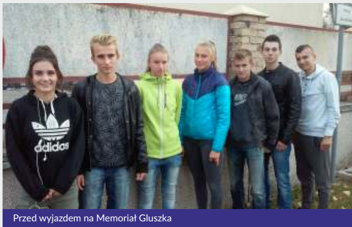
Przed wyjazdem na Memoriał Głuszka

We wrześniu odbyły się dwie wojewódzkie imprezy lekkoatletyczne, na których młodzi lekkoatleci z Dusznik reprezentowali powiat szamotulski w ramach współzawodnictwa powiatów o Puchar Marszałka Województwa Wielkopolskiego.