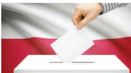
Wybory Samorządowe 2024 >>> str. 10-11