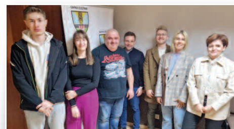
Mieszkańcy wybrali sołtysów i rady sołeckie >>> str. 12-15