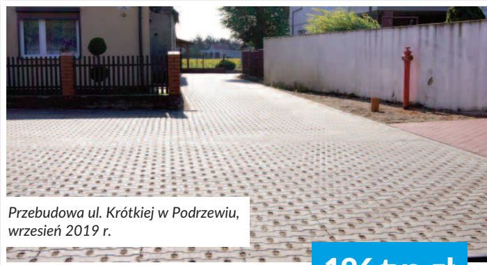
Przebudowa ul. Krótkiej w Podrzewiu, wrzesień 2019 r.