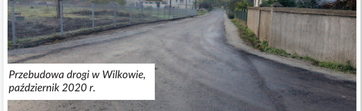
Przebudowa drogi w Wilkowie, październik 2020 r.