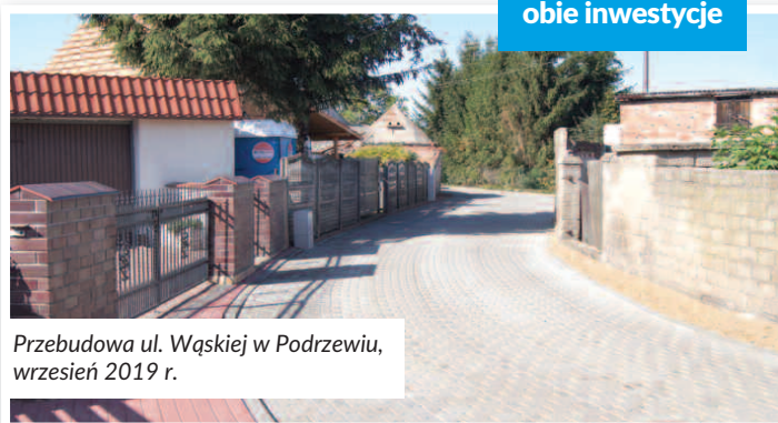
Przebudowa ul. Wąskiej w Podrzewiu, wrzesień 2019 r.