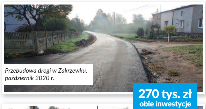
Przebudowa drogi w Zakrzewku, październik 2020 r.