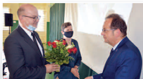
Podsumowanie kadencji 2018-2024 >>> str. 3-9